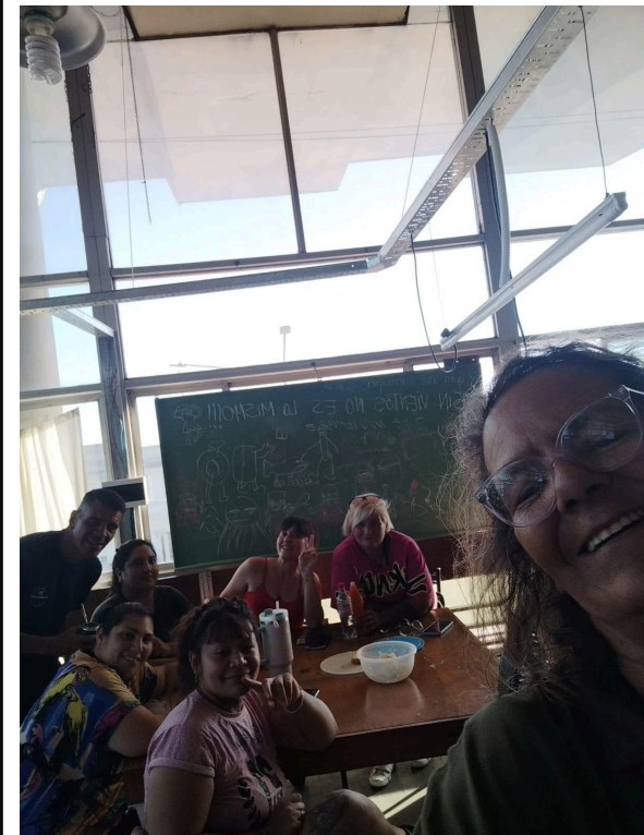
4. Equipo de promotoras en reunion.