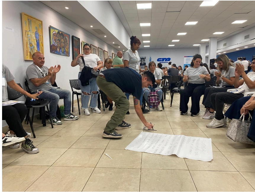
Actividad grupal en la Segunda Jornada Provincial.