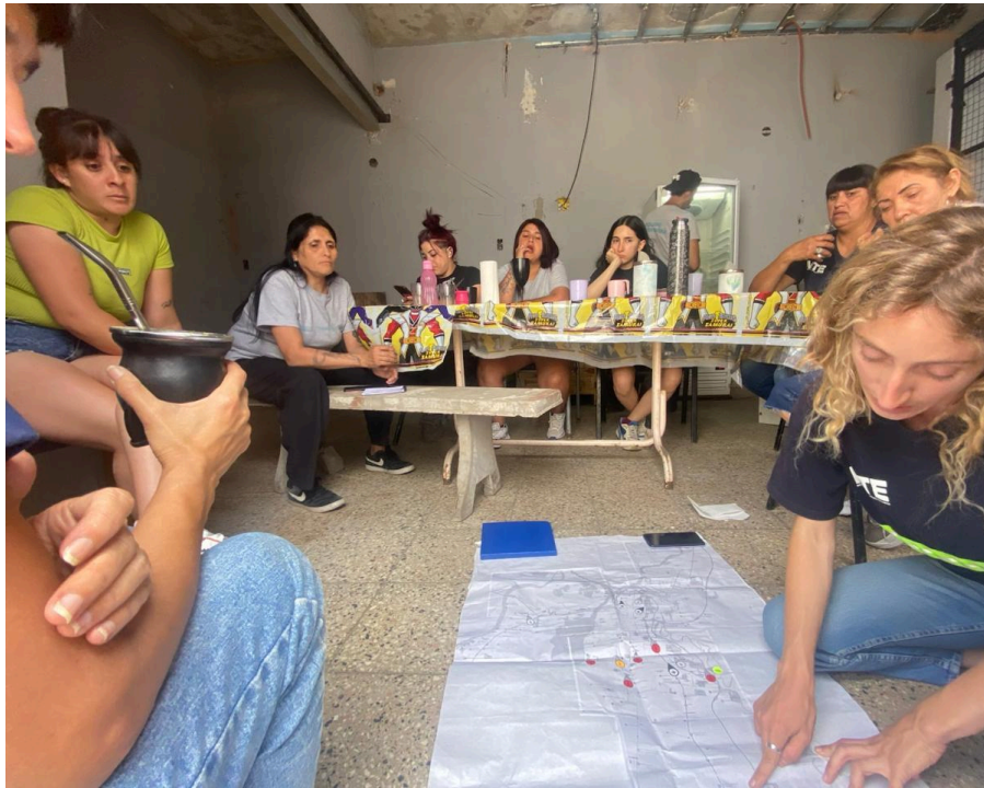
Día de mapeo colectivo de equipos de Tres de Febrero y Hurlingham, y de intercambio de experiencias con una referenta del Proyecto de promotoras de la provincia de Santa Fe.