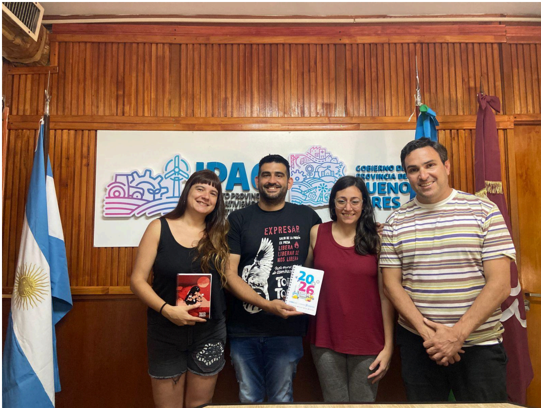
Reunión con Patronato de Liberados de Hurlingham e Ituzaingó.