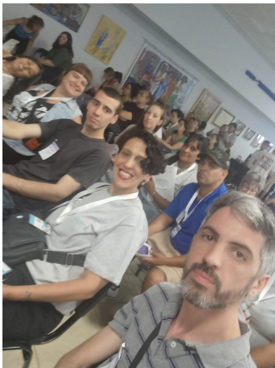
Segunda Jornada Provincial de Intercambio y Formación de Promotoras Territoriales, para el acompañamiento de personas liberadas y en situación de arresto domiciliario.