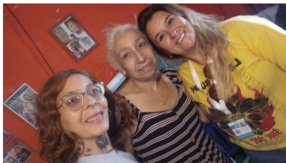
6. Equipo de trabajo con mujer acompañada en el marco del proyecto.