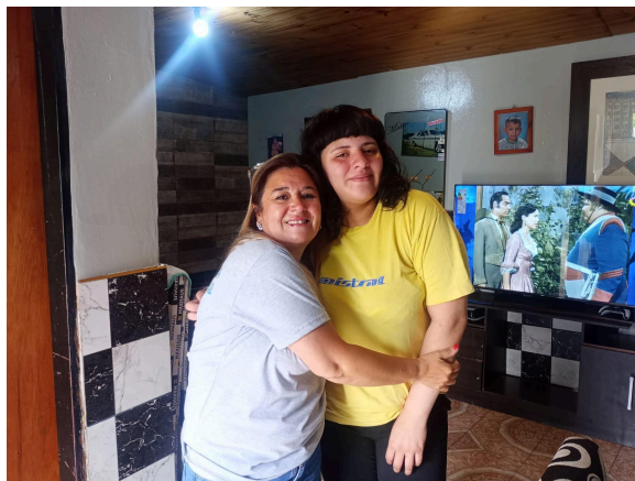
7. Persona acompañada por el equipo territorial