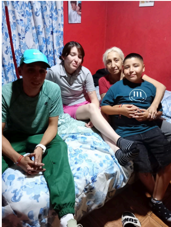
4. familia visitada en el marco del programa