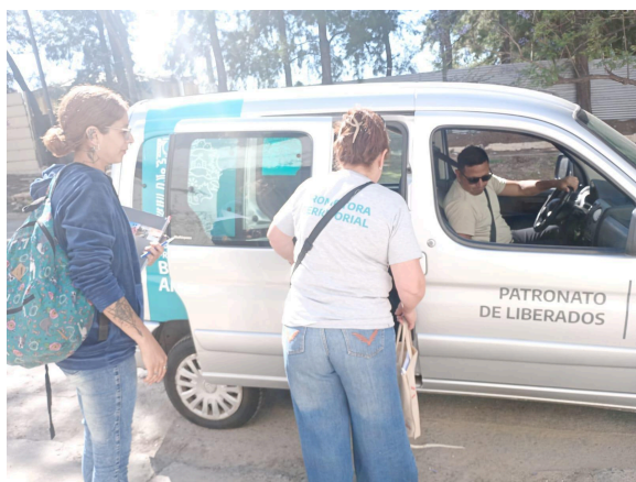
8. Recorrido con Patronato de Liberados