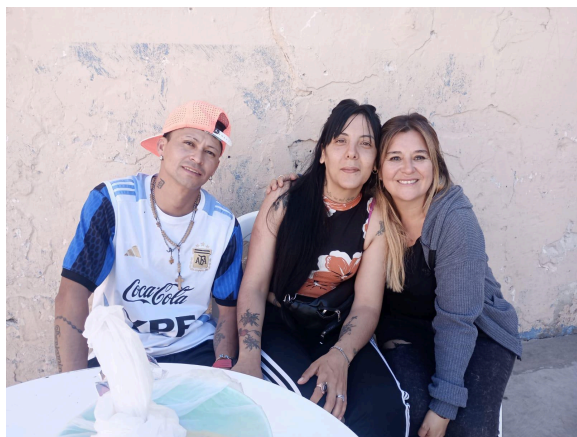
9. Familia acompañada en el marco del programa