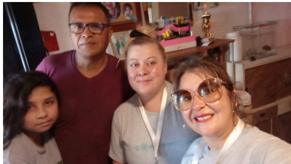
5. Encuentro con familia acompañada en el marco del proyecto