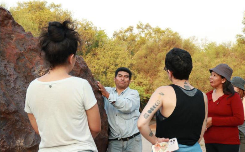
Visita guiada del 11 de noviembre, circuito de meteoritos