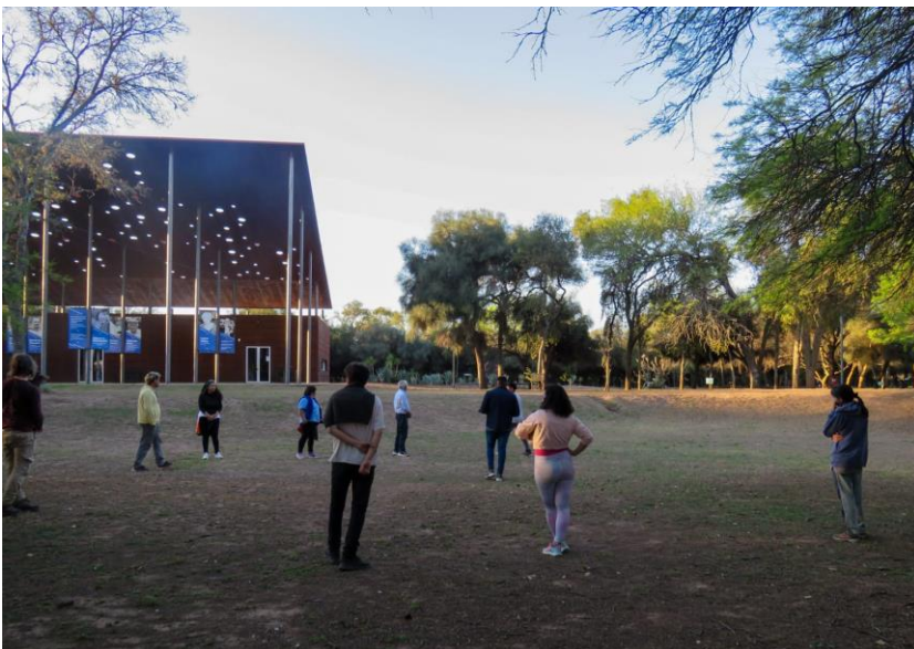
Visita guiada del 7 y 8 de octubre, encuentro en el cráter con los visitantes.