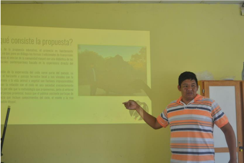
Revisión del dossier 18/11