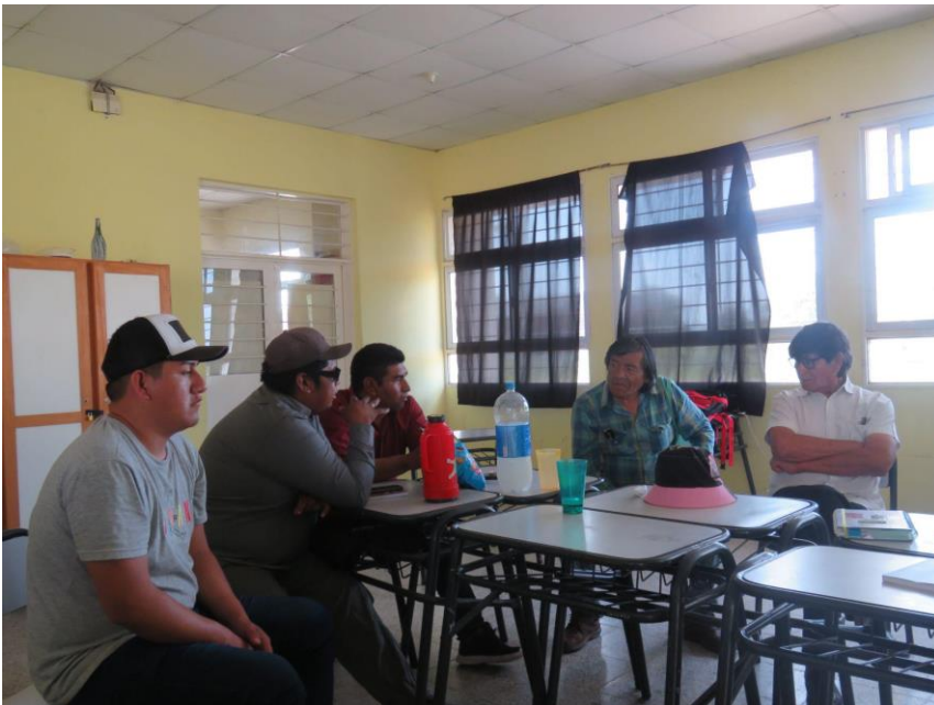
Charla con los ancianos el 18/11