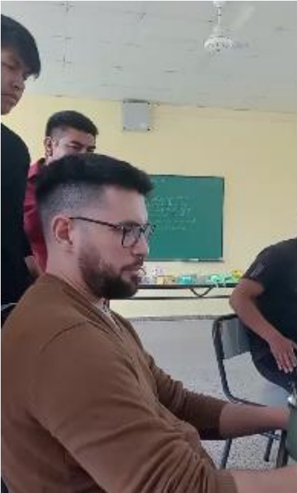
Encuentro del 28/10