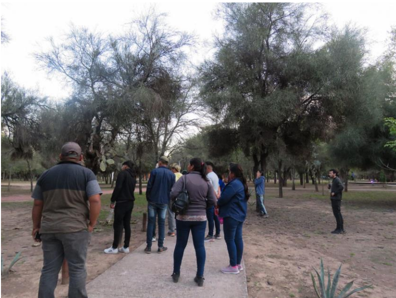
Visita guiada del 7 y 8 de octubre, las/os jóvenes guías junto a visitantes observando los árboles en la Reserva.