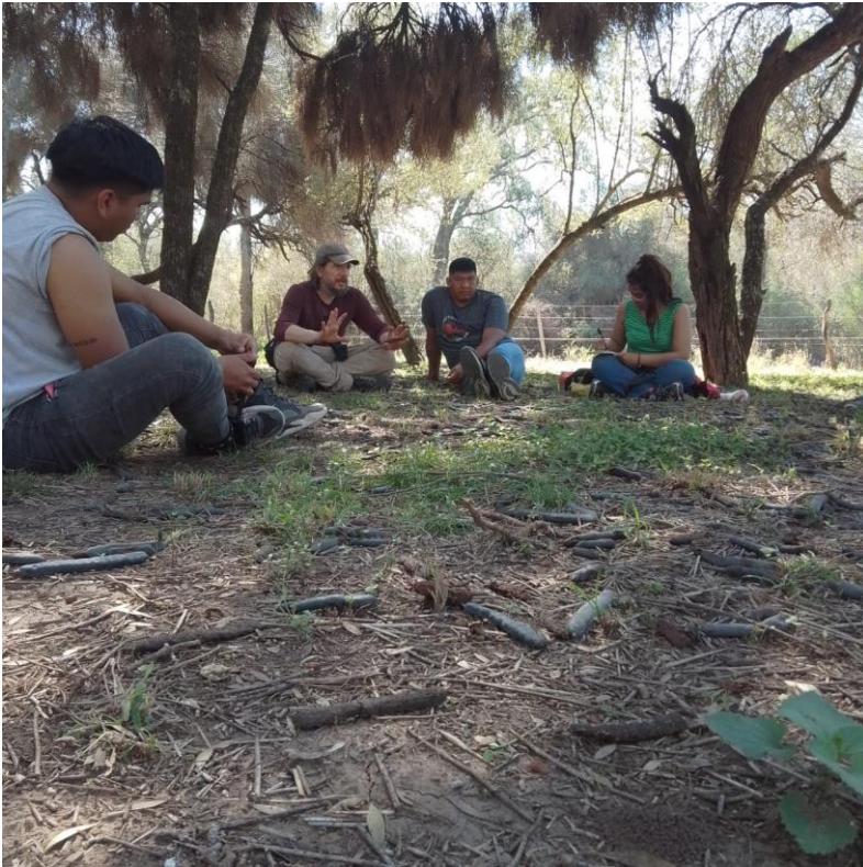
Instancia de evaluación colectiva