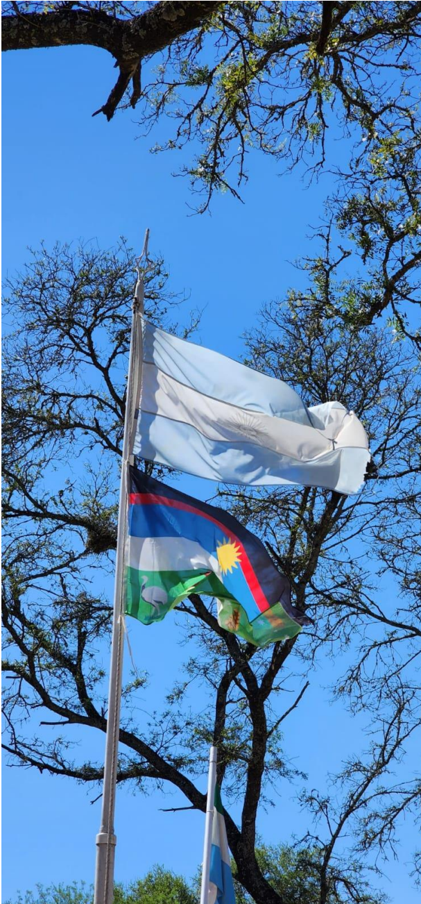
Bandera Moqoit izada en el parque al comienzo de una visita.