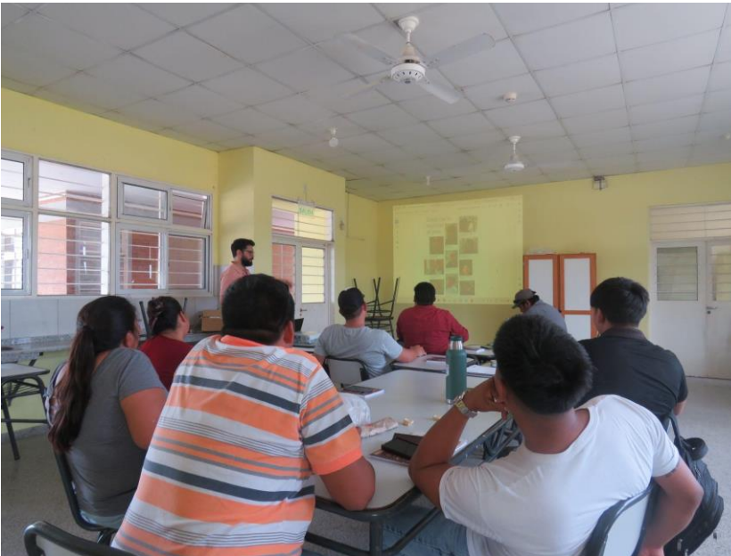
Revisión del dossier 18/11