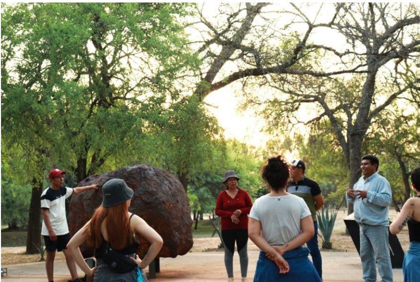
Visita guiada del 11 de noviembre, circuito de meteoritos