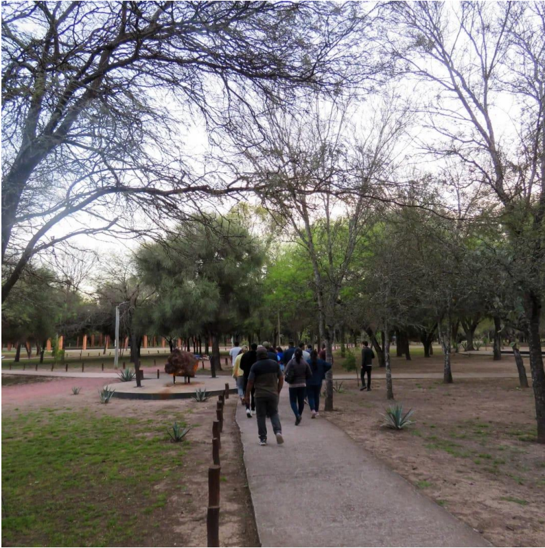
Visita guiada del 7 y 8 de octubre, Circuito de meteoritos.