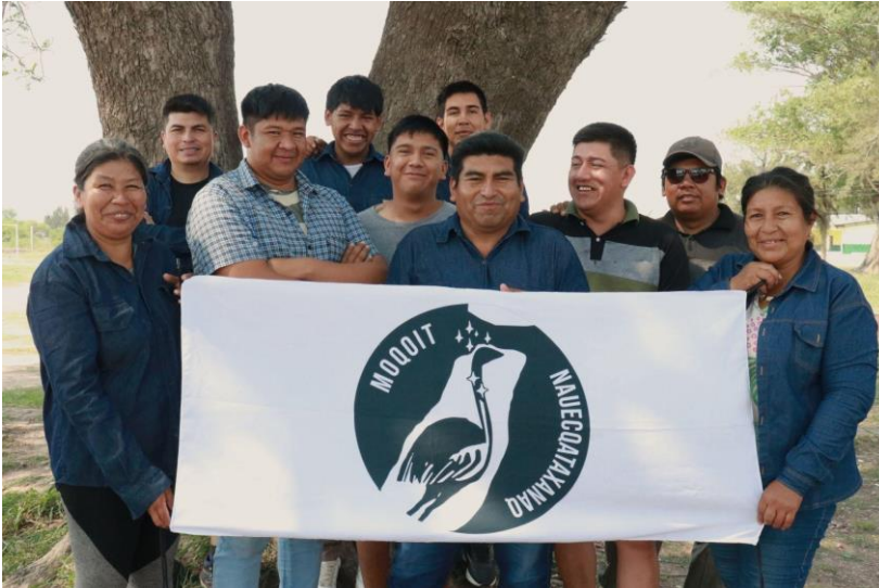
Jóvenes guías moqoit para Campo del Cielo