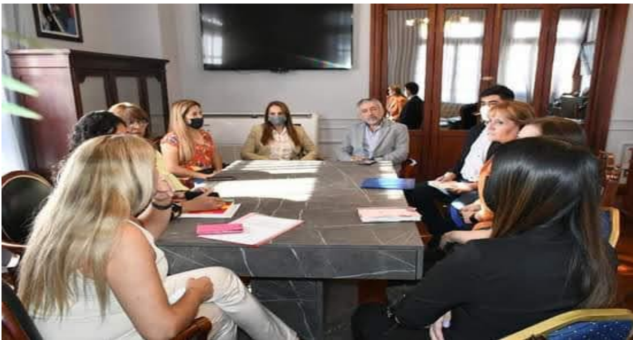
Reunión Secretario Gral. de la Gobernación

Se logró la firma de Actas acuerdo con la totalidad de las Instituciones participantes en el proyecto, en estas se especifica las acciones de trabajo mancomunado para lograr el principal objetivo del proyecto como es la formación y capacitación de los jóvenes en conflicto con la ley y su preparación para la inserción social y laboral.