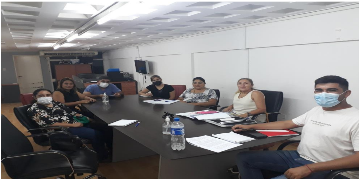
Reunión con Presidentes Centros Vecinales