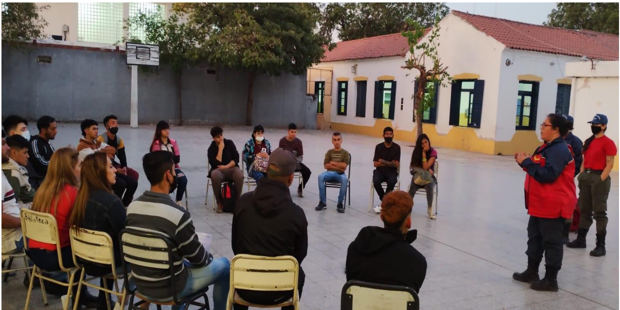
Capacitación de Jóvenes en RCP y Primeros auxilios a cargo de Bomberos voluntario