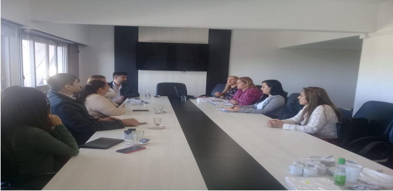
Reunión Directora del Patronato de liberados, Secretaria de Relaciones con la comunidad