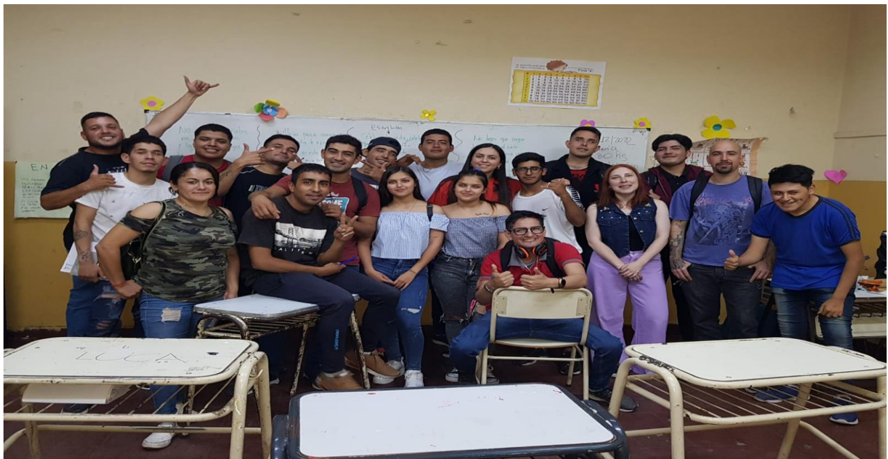
Docentes y alumnos en los Talleres de empleabilidad y Proyecto de vida

En reiteradas oportunidades trabajaron conjuntamente ambos talleres.