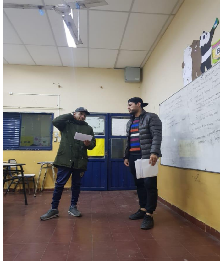
Actividades de los Talleres