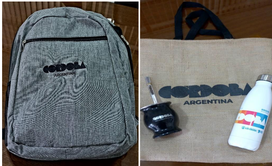
Figura 10 - Ejemplos de Regalos Institucionales

Tarea 2.6: Organizar una visita técnica de inspección a los tomadores de decisión.