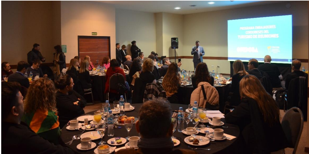
Figura 4 - Armado de Salón Desayuno de Presentación