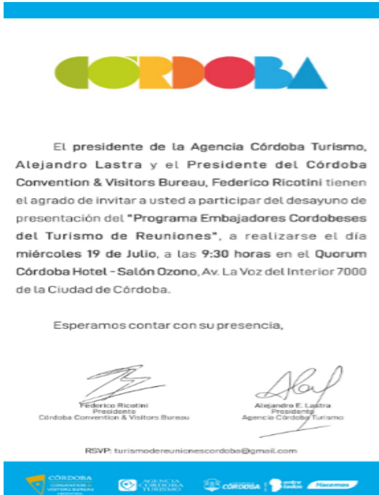
Figura 3 - Captura Tarjetón de Invitación Desayuno de Presentación.

los embajadores seleccionados, así como al resto de los invitados.