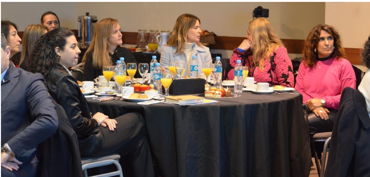
Figura 9 - Directores de Turismo Miembros de la Red Provincial de Destinos Sede.

Al finalizar el evento, y luego de que retiraran los embajadores se realizó una reunión de la Red Provincial de Destinos Sede de Eventos de la Provincia de Córdoba donde se trataron temas específicos a su rol dentro del programa Embajadores, así como también otros temas estratégicos en la gestión del producto Turismo de Reuniones a nivel municipal.