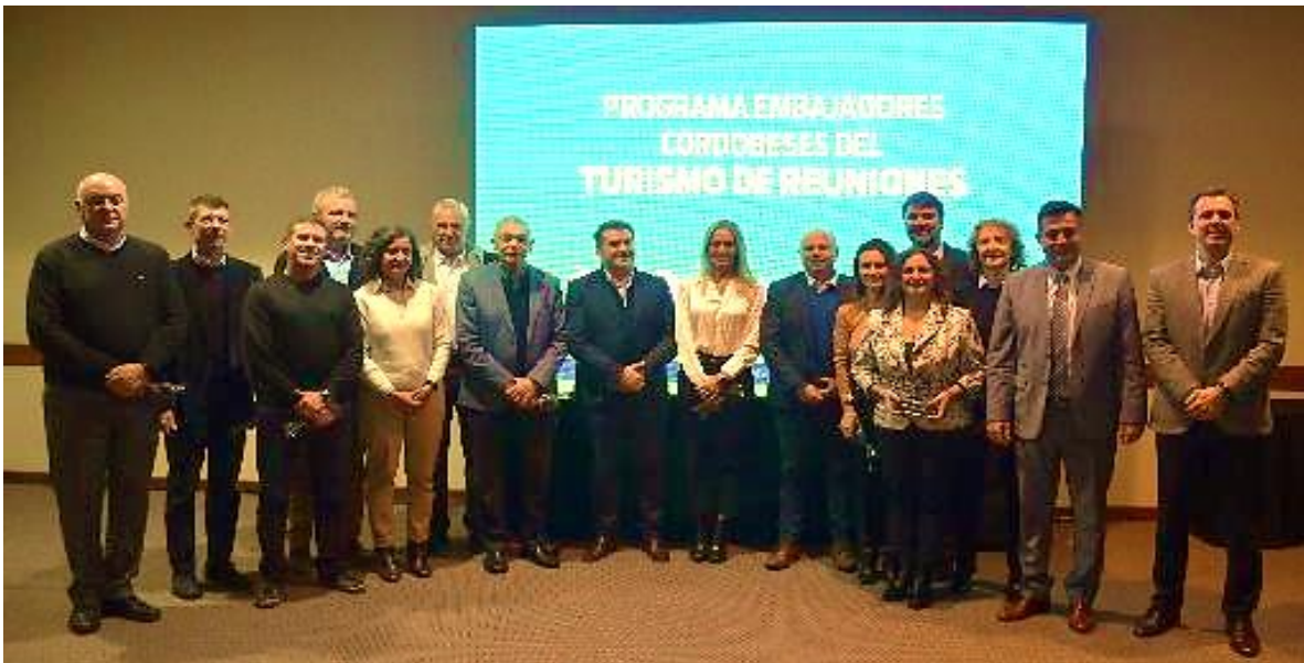
Figura 8 - Foto de Familia de Embajadores y Autoridades

Una vez finalizadas las firmas con cada uno de ellos, se le entregó a cada un bolígrafo personalizado con sus nombres a cada uno de ellos y se procedió a tomar la foto institucional.