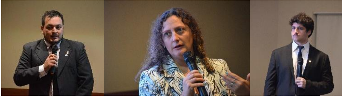
Figura 7 - Presentación Técnica y Testimonial Embajador

10:30 | Firma carta acuerdo de trabajo conjunto con los embajadores.