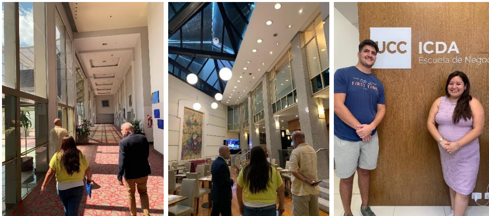
Figura 11 - Site Inspection CLADEA

Desde el Córdoba Convention & Visitors Bureau se proveyó el alojamiento y la gastronomía para los dos representantes durante toda su estadía. Ambos equipos técnicos acompañaron a los representantes de CLADEA durante los tres días como anfitriones y asesores especializados en el destino Córdoba.