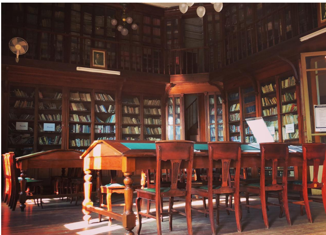
Foto N° 1: Interior de la SOCIEDAD DE FOMENTO ANTONIO MEDINA Y BIBLIOTECA POPULAR CARLOS MASTRONARDI

Finalmente, y tal como se pide en el contrato vigente, integrará este Informe Final un extracto o compendio del contenido esencial de la tarea realizada, resumiendo las características y sus principales conclusiones en una extensión máxima de 2.000 caracteres. Incluirá también imágenes ilustrativas de la totalidad del proyecto.