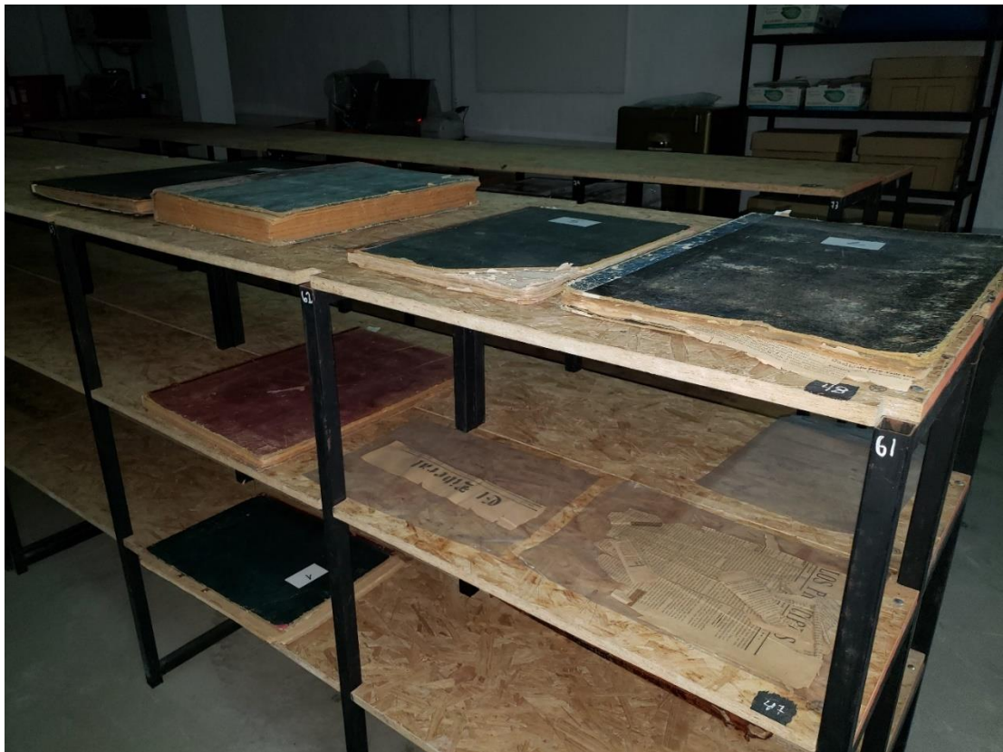
Foto N° 3: Libros de ejemplares de diarios en su lugar de guarda después de desencuadernados. Hojas que se encuentran rotas y se digitalizaron mediante fotografía y posterior conversión a PDF.