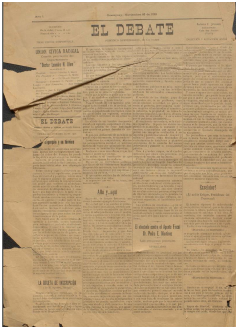
FOTO N° 7: Archivo PDF ya corregido sus márgenes para posterior armado del Libro y del Diario correspondiente.