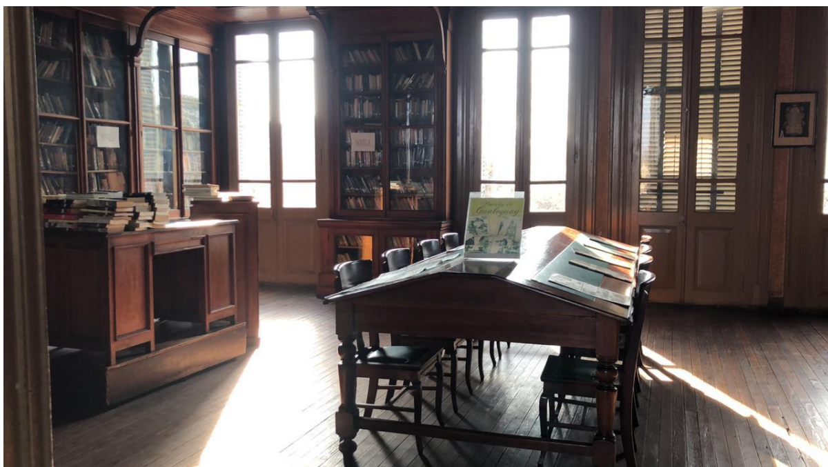
Foto N° 2: otra vista interior de la SOCIEDAD DE FOMENTO ANTONIO MEDINA Y BIBLIOTECA POPULAR CARLOS MASTRONARDI

Y, finalmente, un extracto o compendio de la totalidad de la tarea realizada de no más de 2000 caracteres.