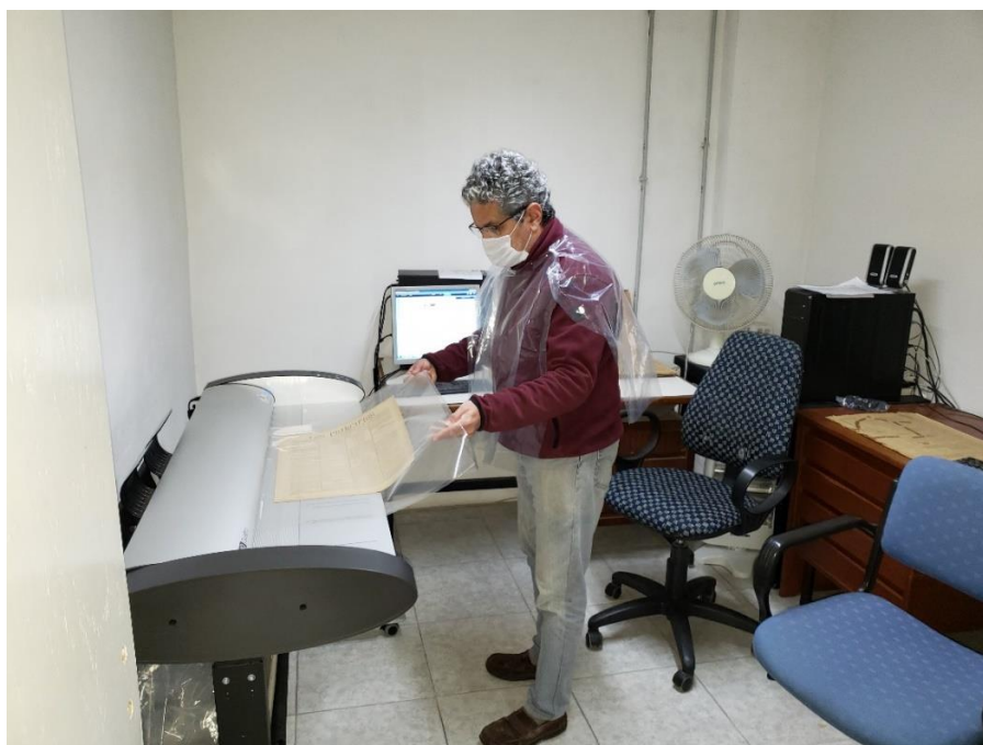
Foto N° 5: proceso de digitalizar cada carilla de los diarios usando Carry Sheet