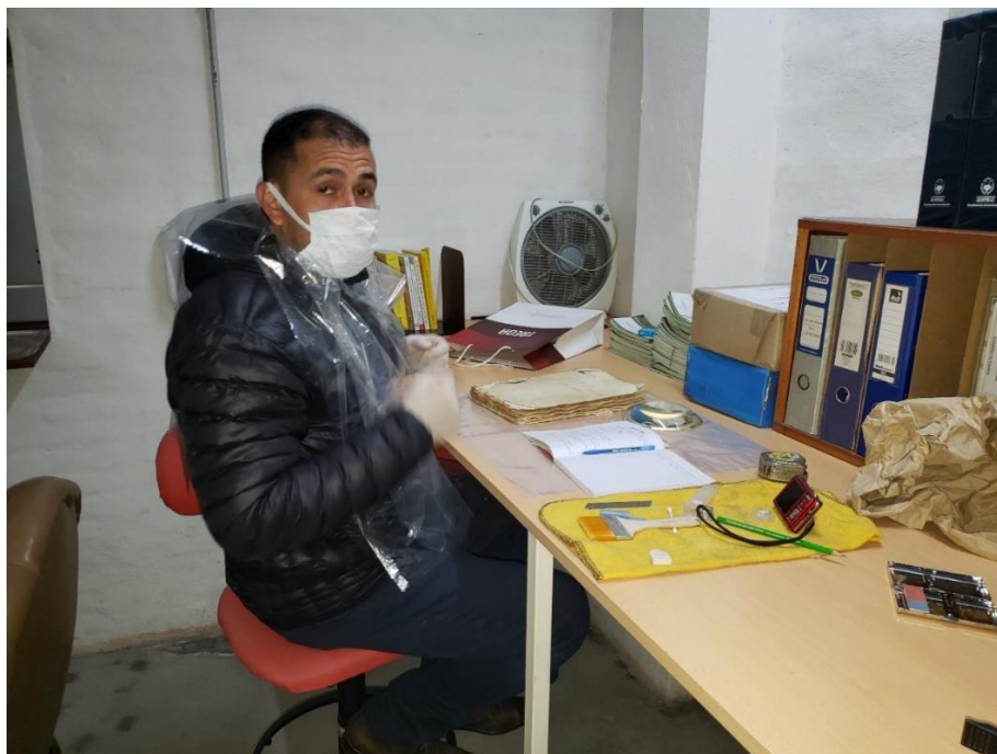
Foto N° 4: cada hoja que lo necesitaba fue sometida a una tarea de limpieza y mínima restauración para permitir su digitalización.