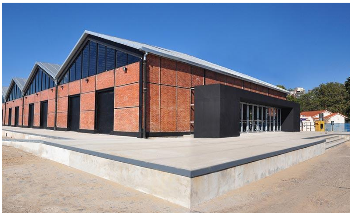
EXTERIOR ESPACIO CULTURAL G15

Anexo D ■ ANEXO D, PLANO ESPACIO INAUGURACIÓN ROSARIO.pdf.pdf