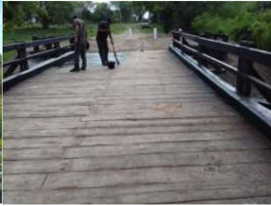
Puente nuevo Misión Laishí

Desde esta perspectiva es que pensamos y elaboramos los posibles productos turísticos en la modalidad y tipología que corresponde para aprovechamiento de determinado recursos patrimoniales identificados en Misión Tacaaglé y Misión Laishí.