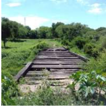
Puente viejo Misión Laishí