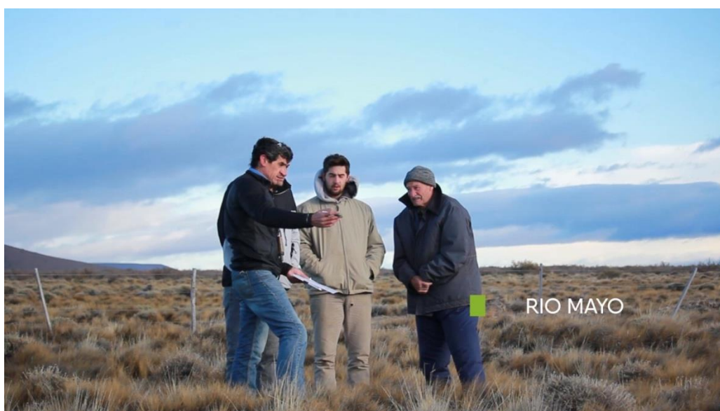
Foto14: Estancia Luisa

1) Video general de resumen de la primera edición de Chubut Regenera