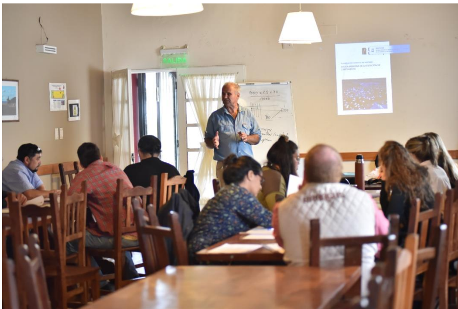
Foto3 Taller Introductorio Comodoro Rivadavia

Introduccionarios para Productores y Profesionales y una Especialización en Ganadería Regenerativa de la que participaron técnicos y profesionales de distintos puntos de la provincia del Chubut.