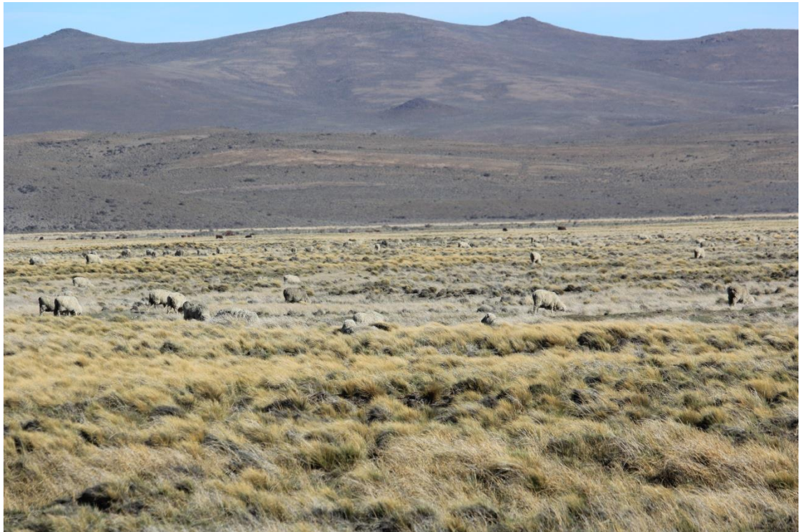
Foto 2 Campos Regenerados

https://www.youtube.com/watch?v=xS_xD1RIKSA