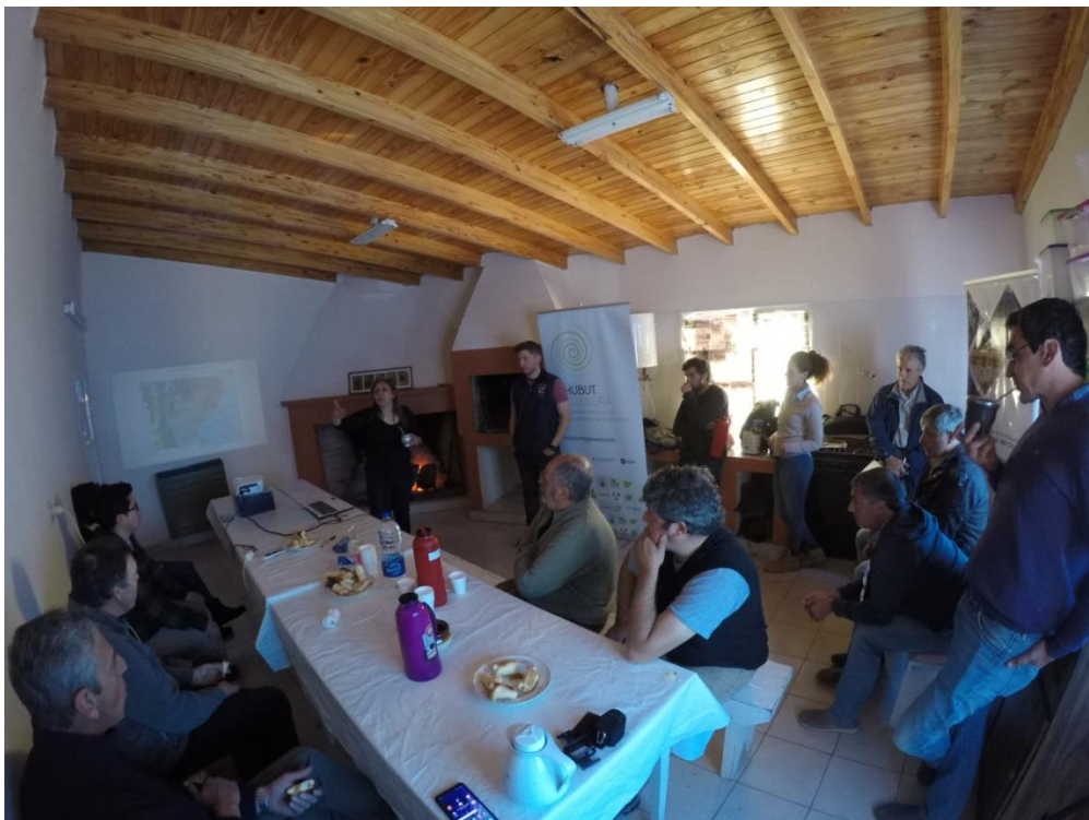
Foto 10 Encuentro de Técnicos en Gobernador Costa