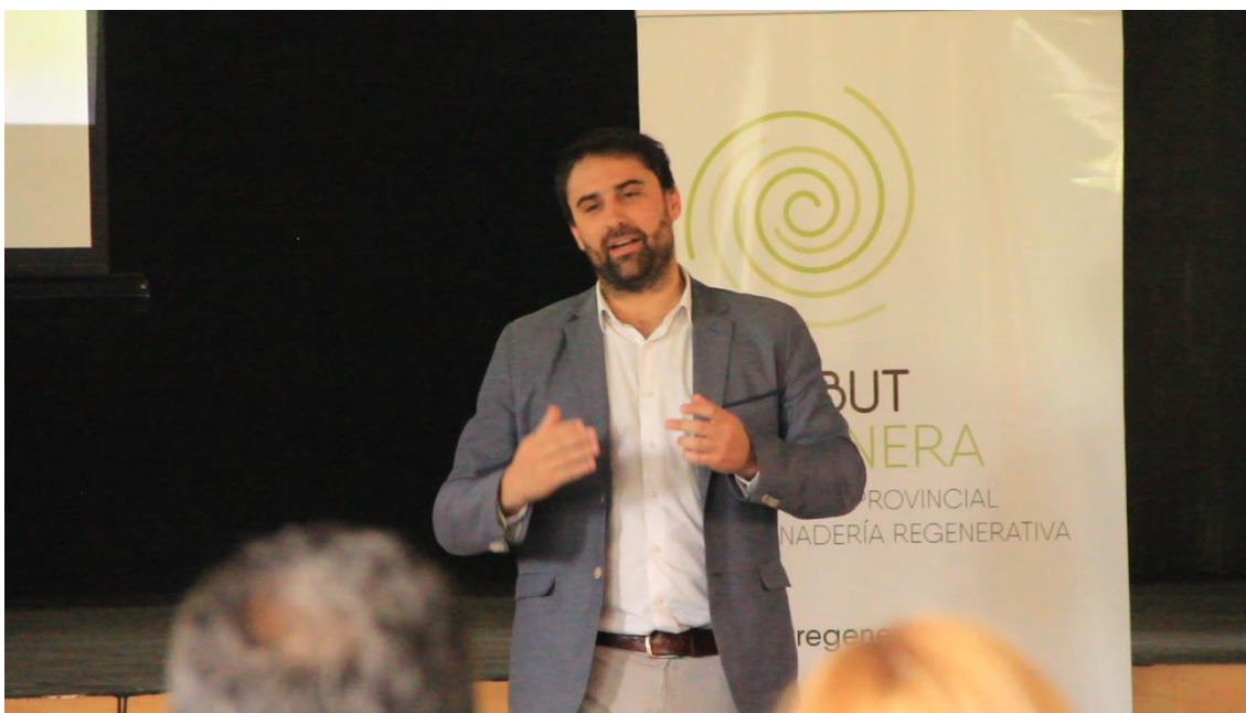
Foto 4. Leandro Cavaco, Ministro de la Producción. Cierre de Chubut Regenera 2019 – Esquel 16/11/19

Originalmente prevista para el mes de octubre, la Jornada de Cierre de Chubut Regenera se realizó el día 16 de Noviembre en la localidad de Esquel. En este caso, se cubrió la jornada y se adjunta material audiovisual en soporte digital. Cabe mencionar que se utilizó material recolectado en dicha jornada para ser incluido en las tareas del punto 5 que se describen más adelante y que se entregan en soporte digital.