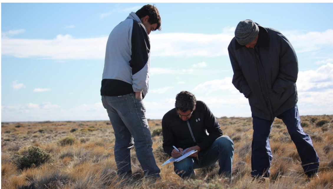
Foto 8 Plan Abierto y chequeo de pastizales

8 y 9/10 en Gobernador Cosa y José de San Martín. Se trabajó en doble jornada por pedido del equipo del Programa de Ganadería Regenerativa dado que en estos días iba a reunirse el equipo completo de trabajo, es decir los