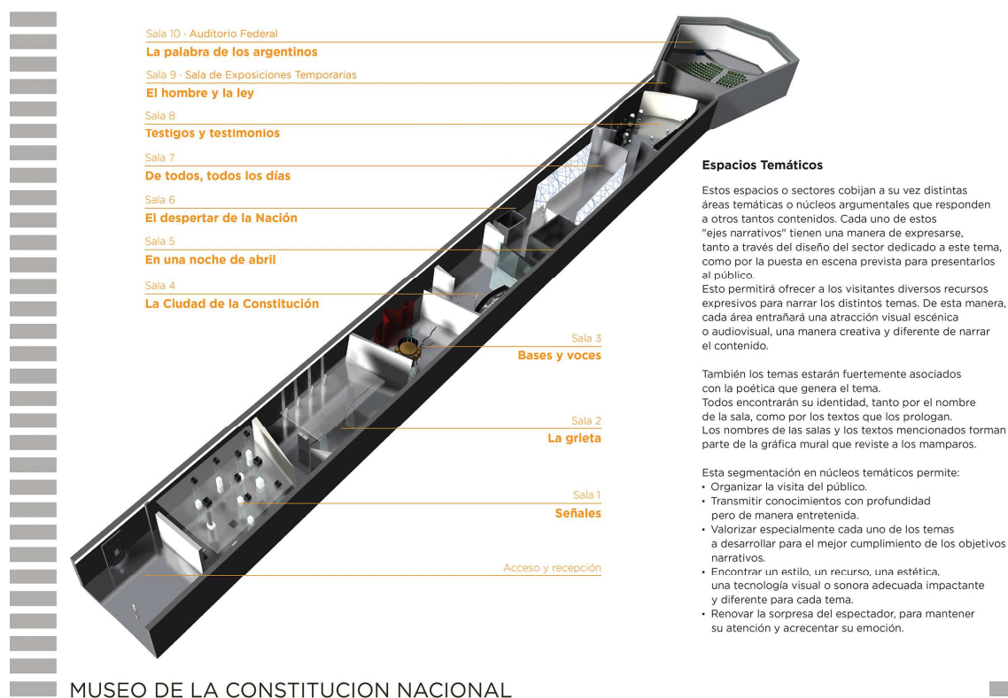
(Figura 1: Espacios Temáticos del Museo-10 salas interactivas)

El film fue concebido como una mirada de la Constitución Nacional desde nosotros mismos, para que los futuros visitantes del museo, sean protagonistas de una experiencia sensorial inolvidable.