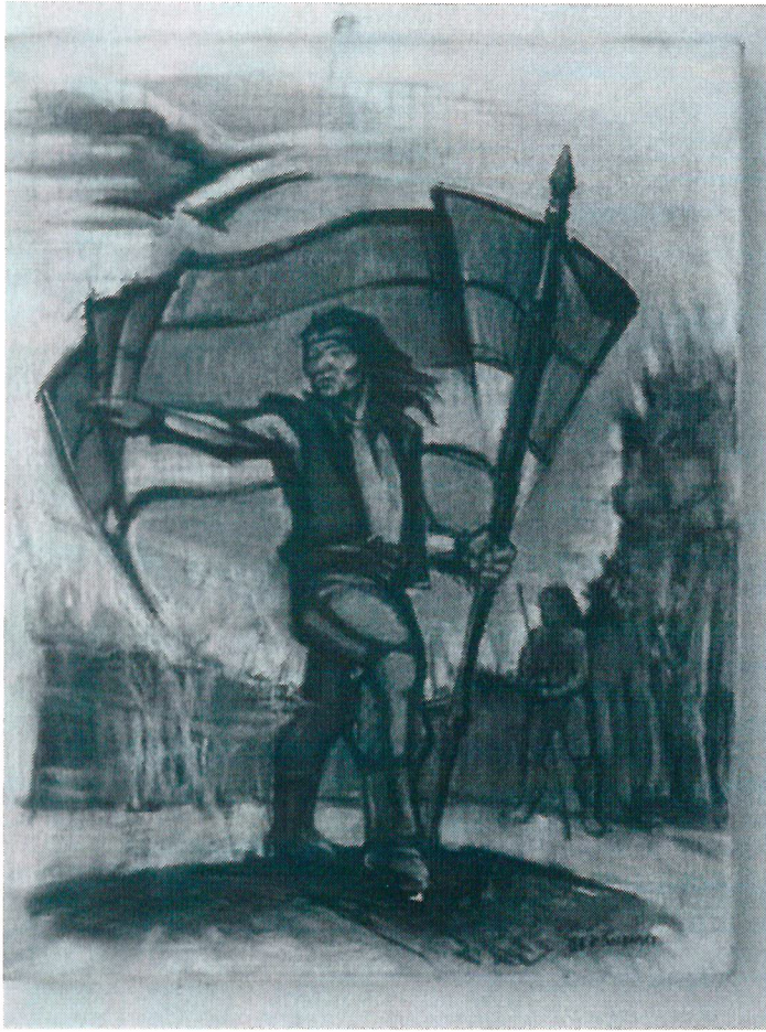
Andrés Guacurari y la bandera misionera.