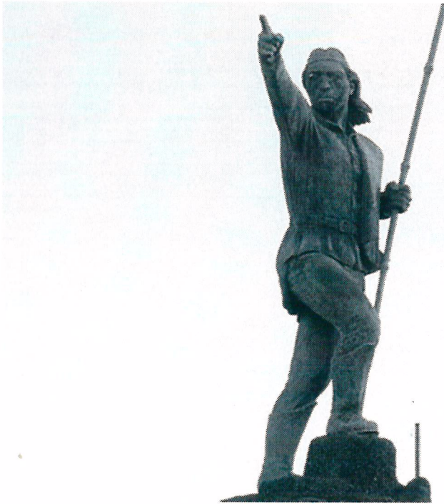
Fotografía del monumento a Andrés Guacurarí en la ciudad de Santo Tomé (Corrientes)