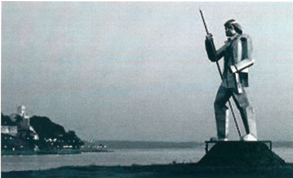
Monumento a Andrés Guacurarí en la costanera de Posadas, Misiones.