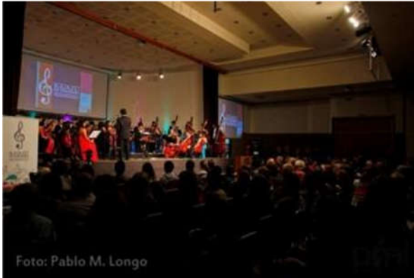
Centro de Convenciones Amerian