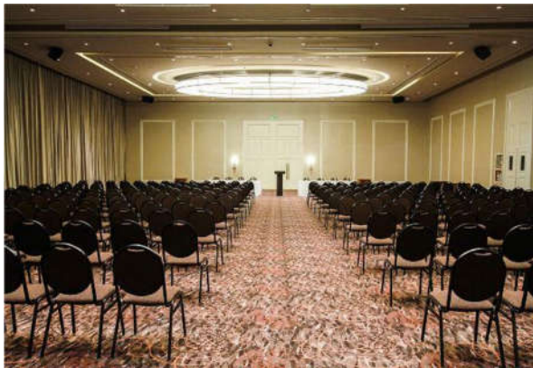
Hotel Iguazu Grand