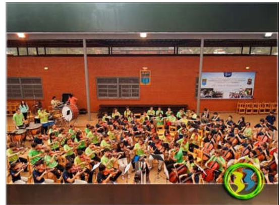
Escuela Doña Mercedes de Taratuty