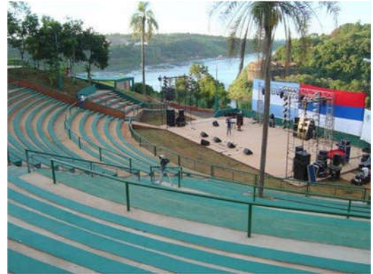
Anfiteatro Ramón Ayala