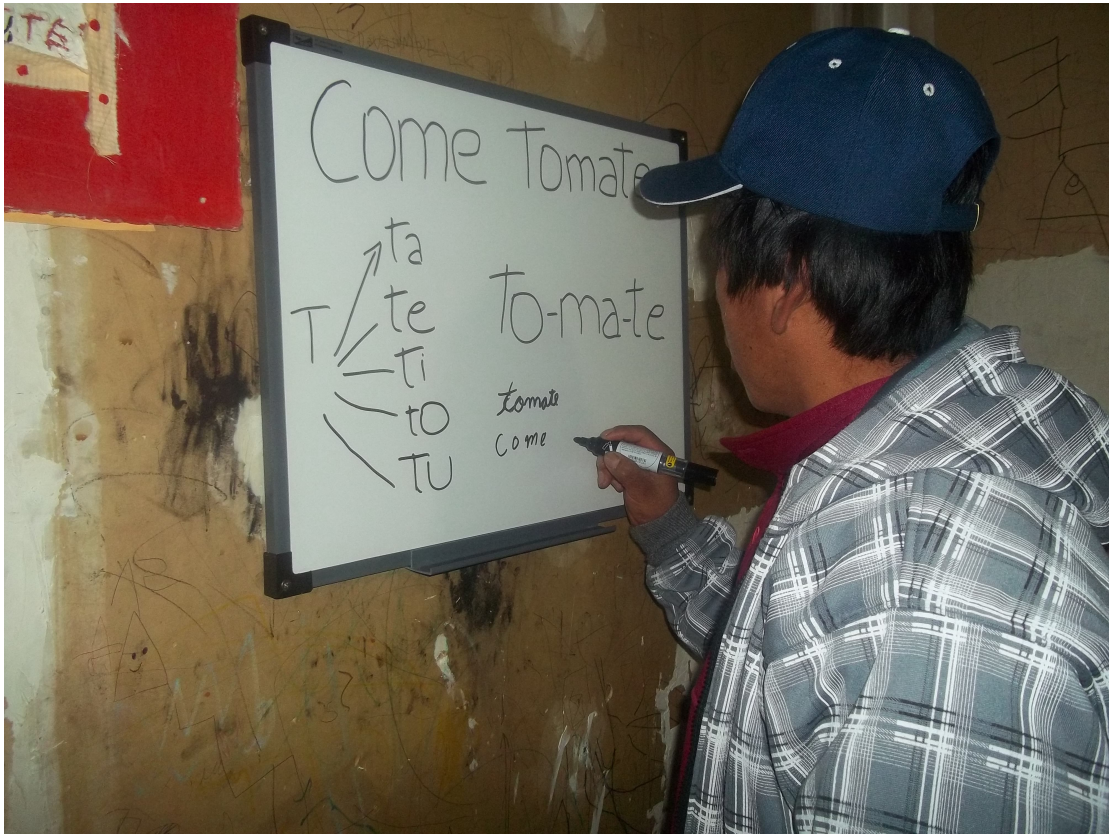
Barrio el Escondido Ushuaia