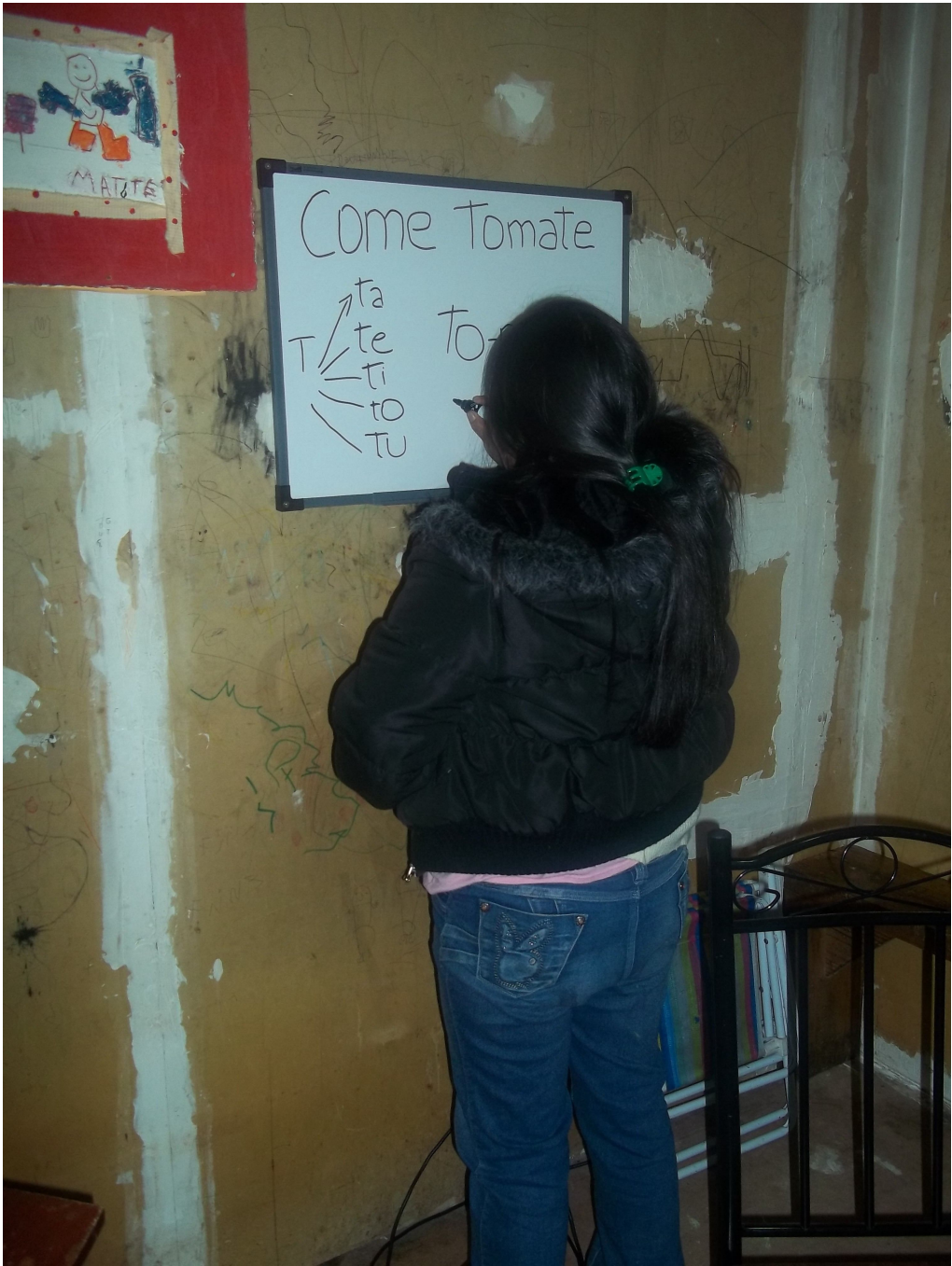
Barrio el Escondido Ushuaia