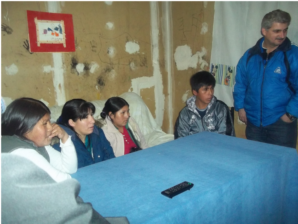
Barrio el Escondido Ushuaia