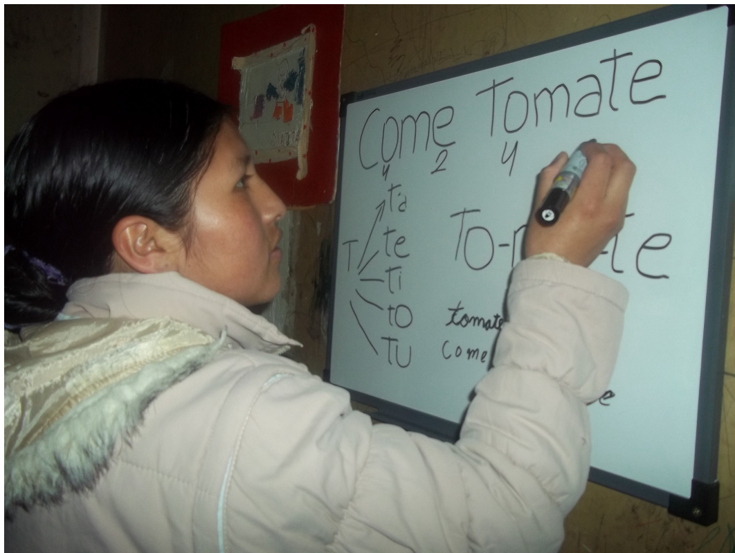
Barrio el Escondido Ushuaia