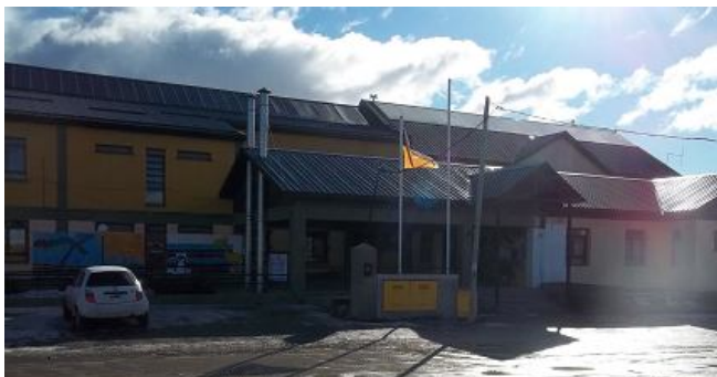
Colegio Trejo Noel. Tolhuin