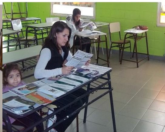
Encuentro 3 "Momento para pensar"