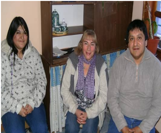
Tarea 8. Devoluciones individuales.