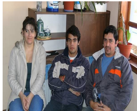
Tarea 8. Devoluciones individuales.