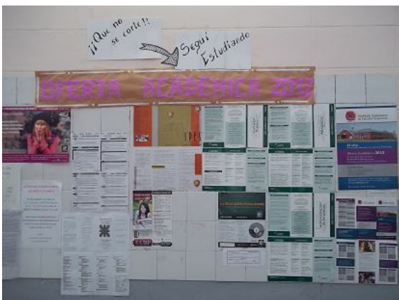
Cartelera con la oferta educativa de Nivel Superior.