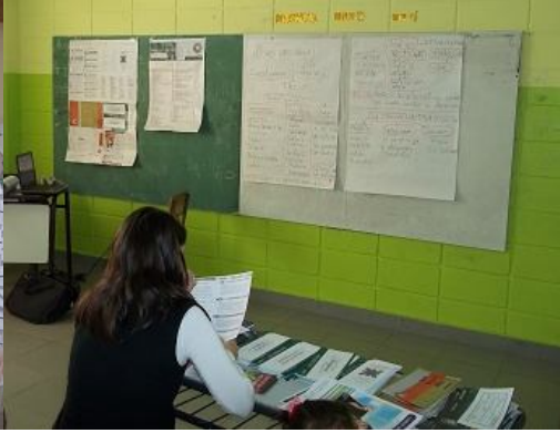
Encuentro N° 3- “Momento para pensar”