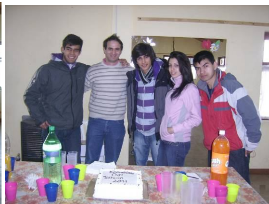
Jornada de cierre.