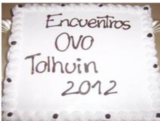
Jornada de Cierre.