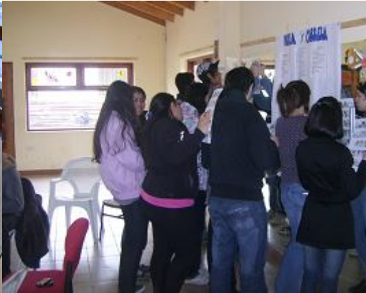
Encuentro N° 4- "Aclarando ideas". Test CHASIDE