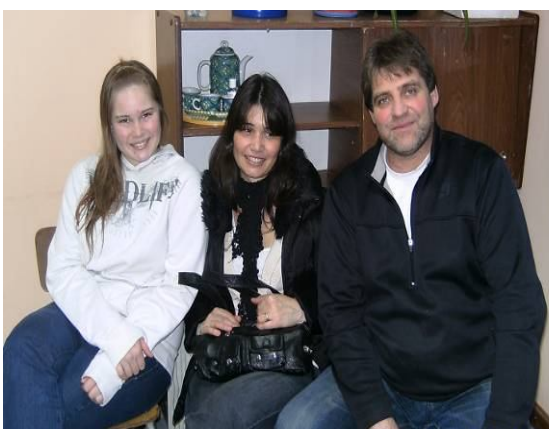
Tarea 8. Devoluciones individuales.