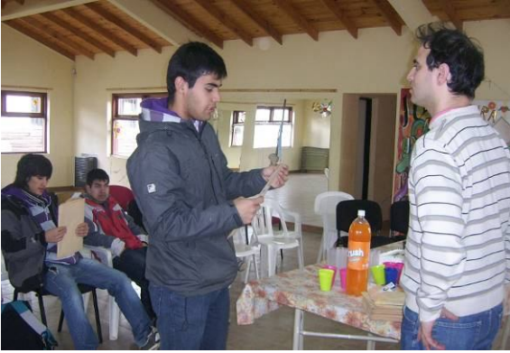
Jornada de cierre.