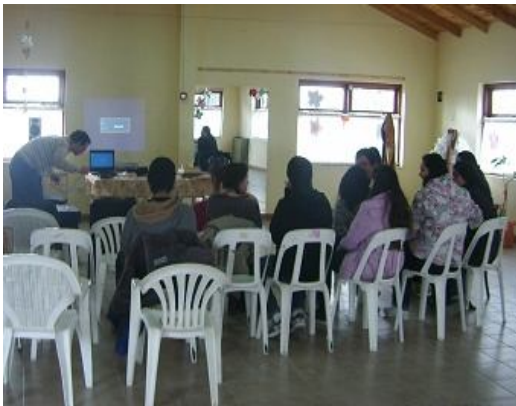
Encuentro 1 "Presentación y Test frente al futuro"