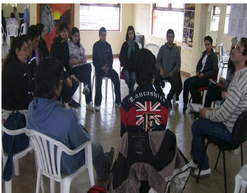
Encuentro 2 "Frases Incompletas" y "Mitos"