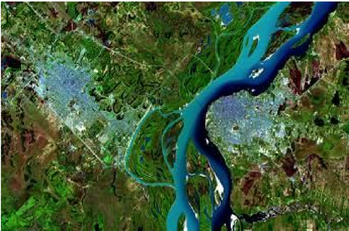
Foto satelital Microregión Corrientes-Resistencia

Los nuevos paradigmas del desarrollo local sustentable y las actuales tendencias de gobernanza, está obligando a los gobiernos locales (provinciales y municipales) a redefinir y asumir nuevos roles como verdaderos promotores del desarrollo de sus territorios. En este contexto se insertó el trabajo de Relevamiento de Información para el Plan estratégico – Región 1: capital que se inició con la generación de una Matriz de Actores Estratégicos y de Intereses en el territorio,