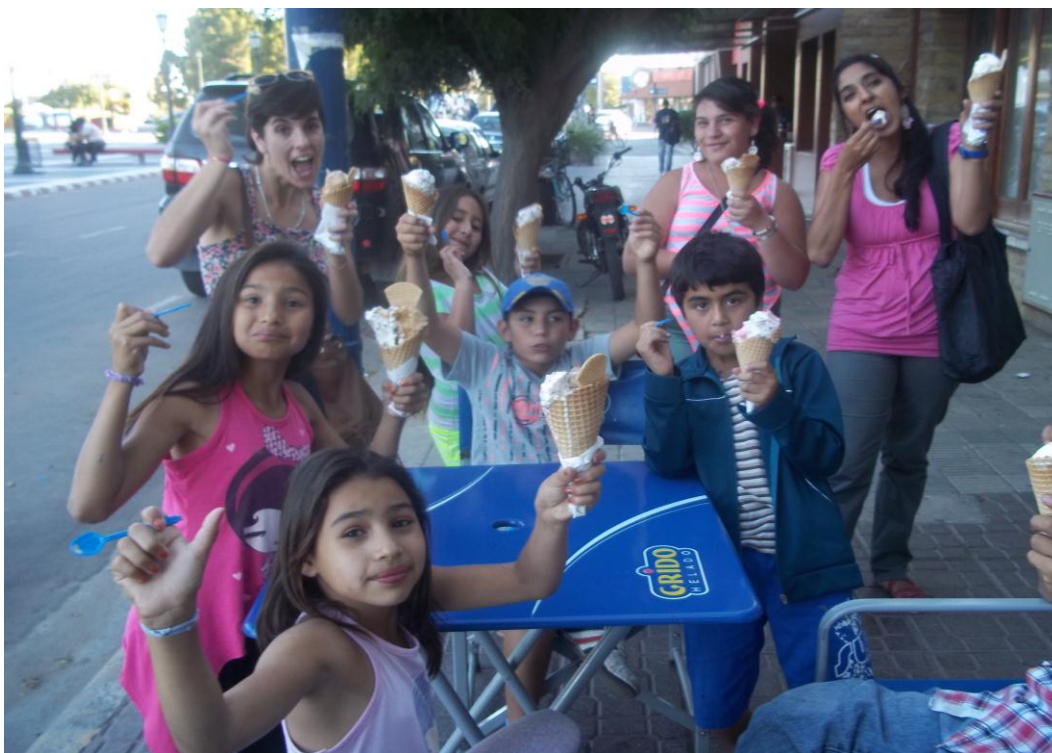
“Salidas durante el Verano”