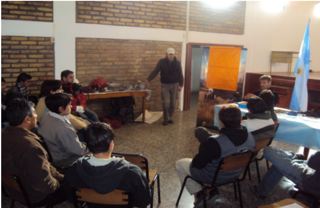
Capacitación teórica: Famatina Tirolesa en Famatina