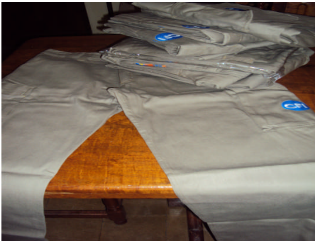
Uniformes de Guías para los grupos