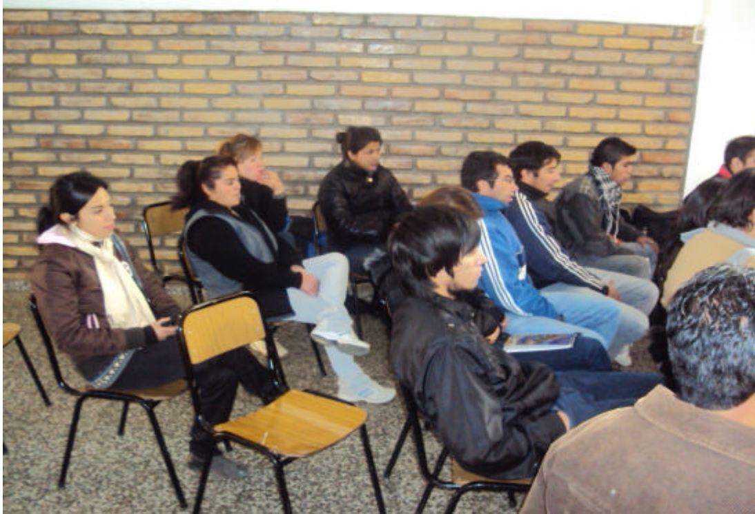
Capacitación teórica en Famatina