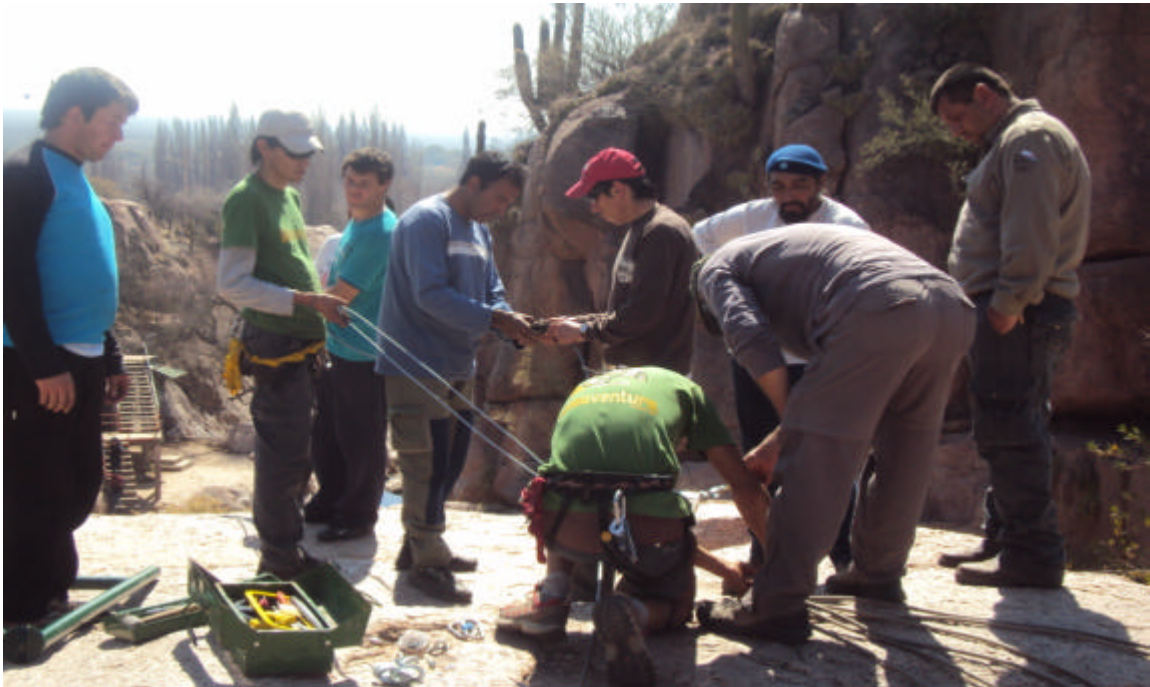
Representantes; Grupo Huellas, Grupo Miranda, y San Blas de Los Sauces