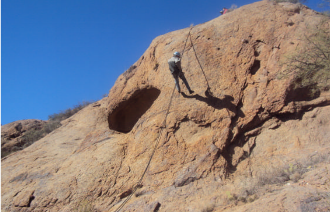
Rappel en Famatina Representantes de Grupo Miranda y Guía de Famatina