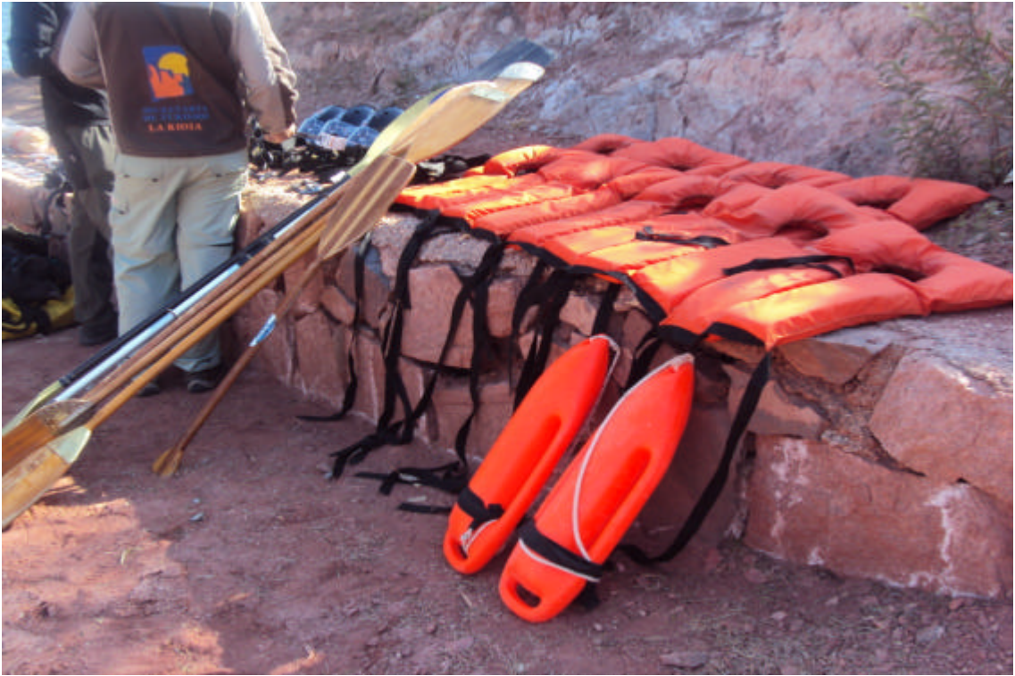
Entrega de equipos