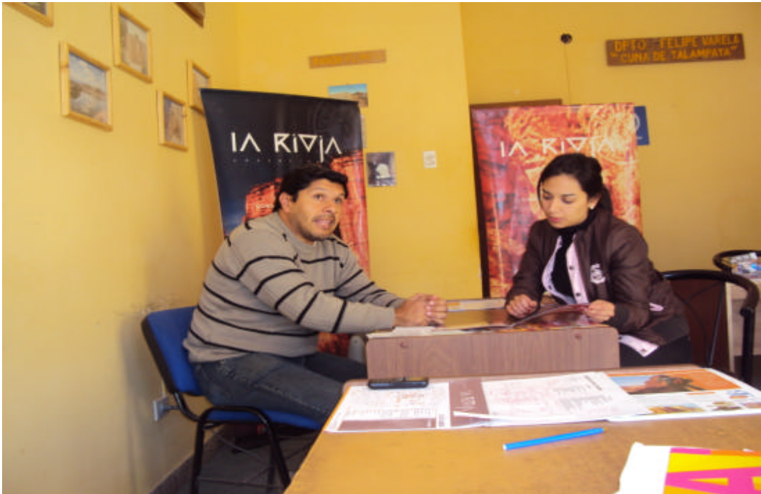
Reunión con Director de Turismo Participantes de la capacitación en Sede del Grupo Runa Mayu