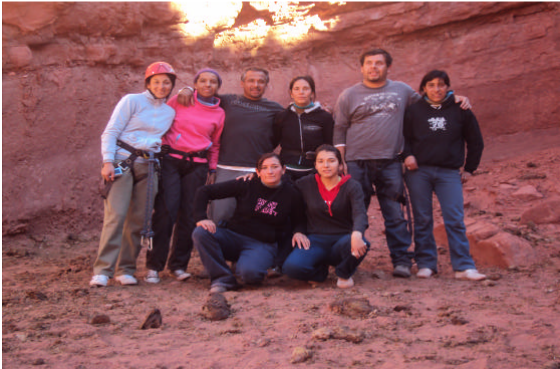
Grupo Huellas – Guandacol – Grupo Huellas y Runamayu