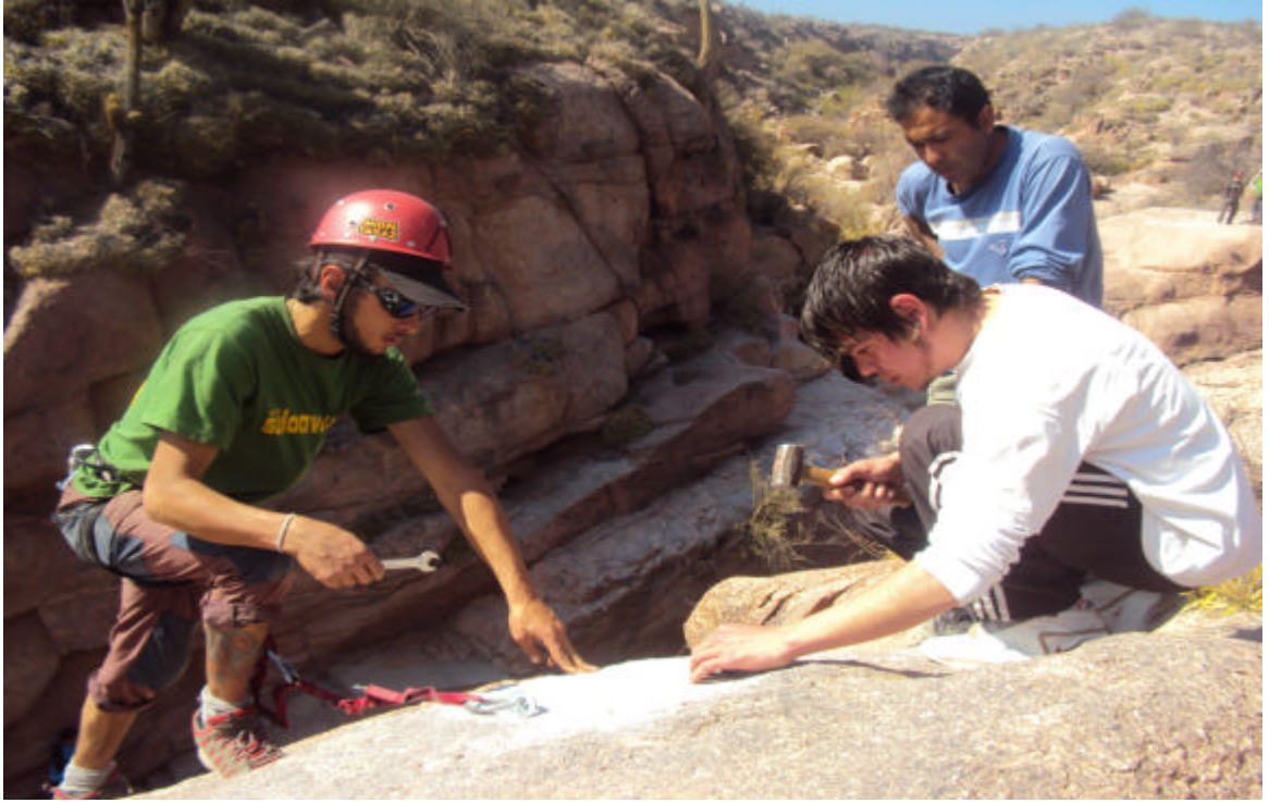
Encuentro en San Blas de Los Sauces