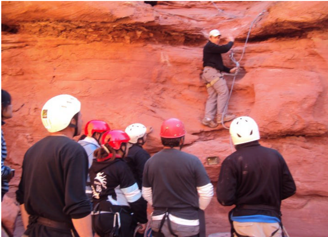
Vía Ferrata, Rappel y Tirolesa en Banda Florida – Villa Unión-