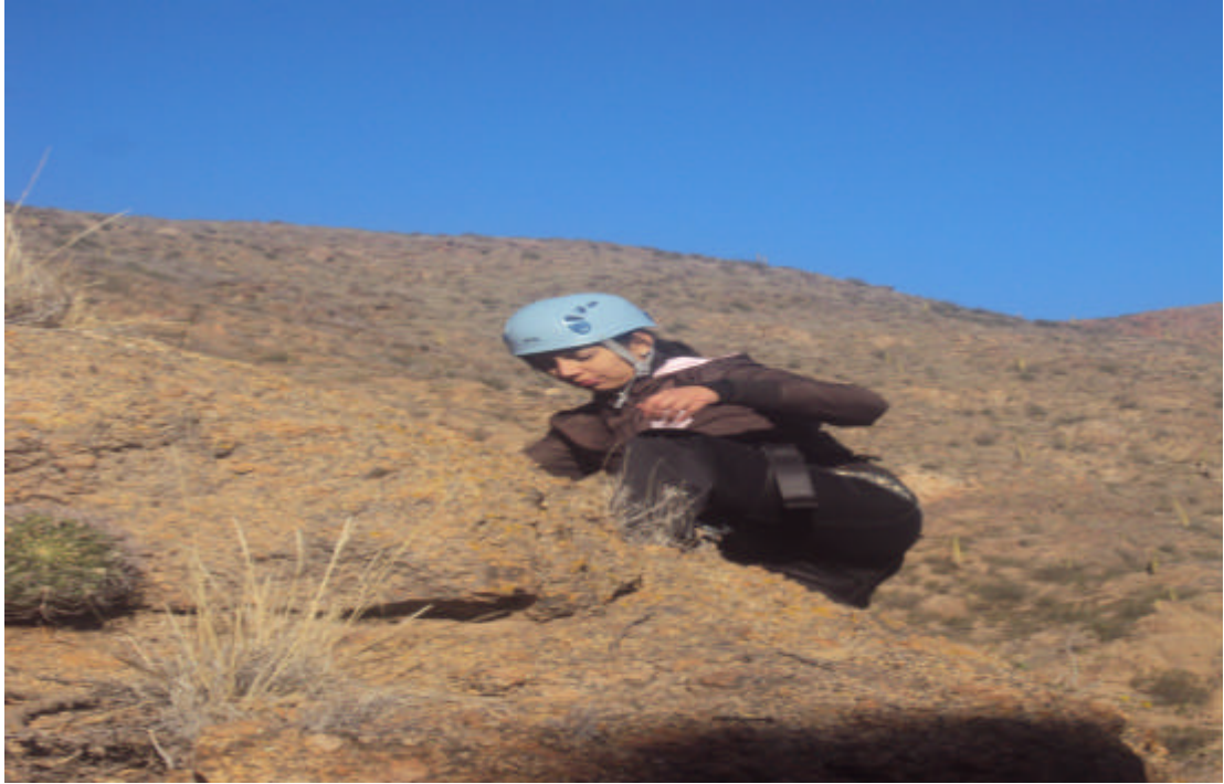
Vía Ferrata en Famatina