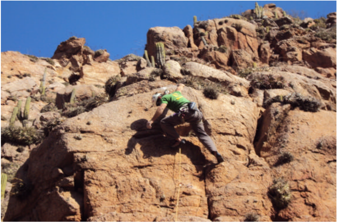
Escalada en Guandacol- Dpto Cnel. Felipe Varela