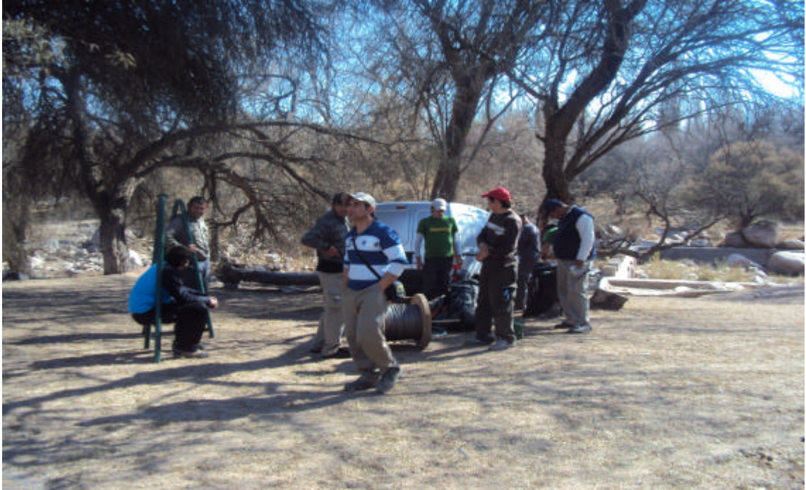
Encuentro en San Blas de Los Sauces – 1° Día Instalando Rappel