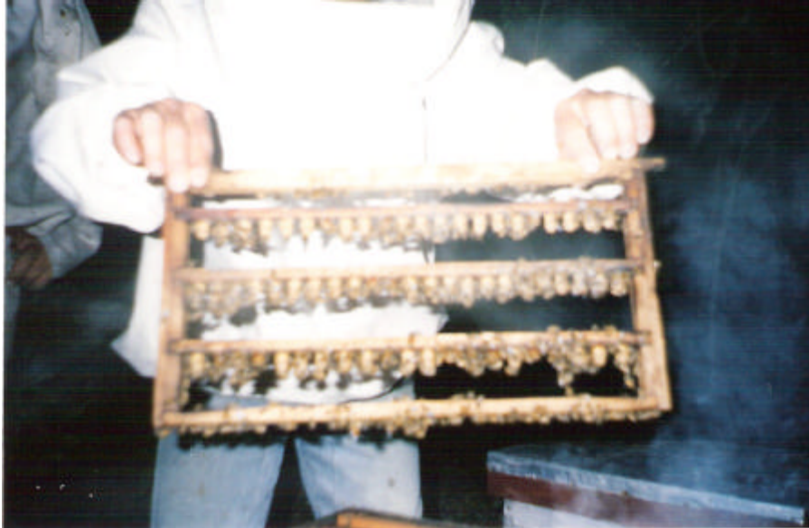
Listones con celdas reales operculadas. Criadero "Abejas del Taragüi"

A primeras horas de la tarde los participantes y organizadores nos dirigimos a Saladas, donde se mostró el colmenar criadero en producción y se mostró en detalles el canasto técnico utilizado actualmente para la producción de núcleos.