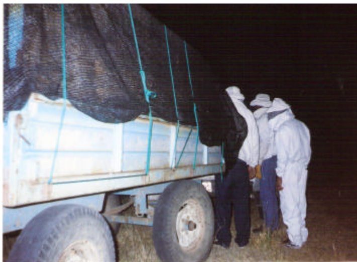
18/09/08 Acoplado cargado con el material vivo para beneficiarios de Lavalle.

Se propuso oportunamente a los iniciadores de Lavalle que conformen colmenares colectivos hasta llegar a la etapa de multiplicación, para aprovechar todas las ventajas del trabajo grupal y propiciar las visitas de apoyo técnico con mayor frecuencia, pero finalmente optaron por instalar las colmenas por separado.