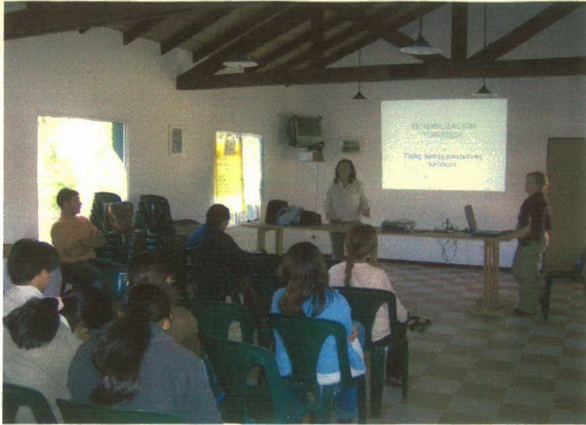
Foto: Lic. Florencia Aversa a cargo del Taller de Sensibilización Turística en Cushmanen.

El taller se realizó en el centro comunitario de la localidad. En esta oportunidad participaron alrededor de veinticinco personas, entre los que se encontraba el representante del museo local, la concesionaria de la estación de servicios (lugar de parada de los visitantes a la zona), personal policial, personal de la comuna rural y alumnos de EGC 3 de la escuela del casco urbano.