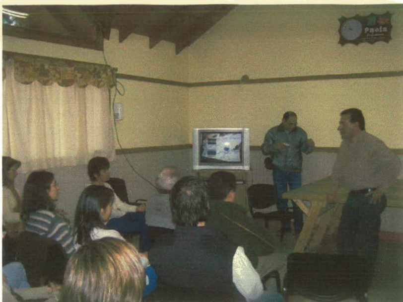
Foto: Coordinador de turismo de Gualjaina dirigiéndose a los presentes.

En esta oportunidad también se invitó a medios de comunicación locales y a operadores turísticos de la zona como para que puedan contar con esta alternativa para trabajar en conjunto y establecer contacto permanente.