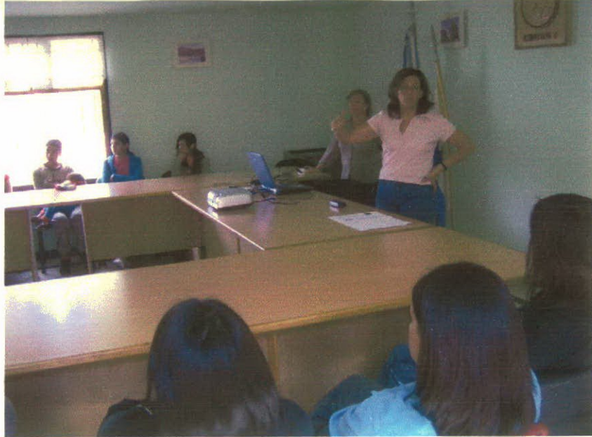
Foto: Lic. Aversa desarrollando el Taller en la localidad de Gualjaina.

Por último, los participantes manifestaron su interés por todas las actividades que cada vez más notorias son en la zona y que están vinculadas al turismo. Entre las inquietudes planteadas se presentó la posibilidad de desarrollar algún tipo de capacitación de mediano plazo para realizar en la localidad.