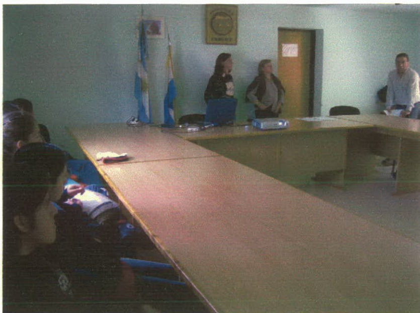
Foto: Coord. de Turismo Municipio de Gualjaina presentando el interés del Municipio en la realización del Taller.

El taller en esta localidad se desarrolló en las instalaciones del Concejo Deliberante, con la concurrencia del Guardafauna local, capacitado en la etapa anterior de trabajo, tal como lo preveía este PPC; también asistieron integrantes de la comunidad que vienen participando en diferentes capacitaciones que se desarrollan en la zona respecto del turismo y alumnos del Polimodal que funciona en el casco urbano de la localidad.