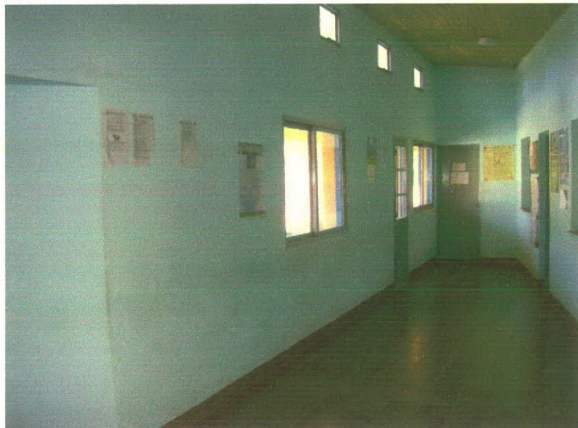
Foto: Sección del edificio de la Comuna rural de Paso del Sapo donde se colocarían las vitrinas de exposición.

Durante esta segunda etapa se terminó de definir cuál sería la propuesta de realización en el edificio de la Comuna Rural. Considerando los tiempos disponibles para la realización de la obra y el monto de inversión necesario para realizarla, se decidió en principio colocar dos vitrinas dentro del edificio y luego evaluar la otra posibilidad.