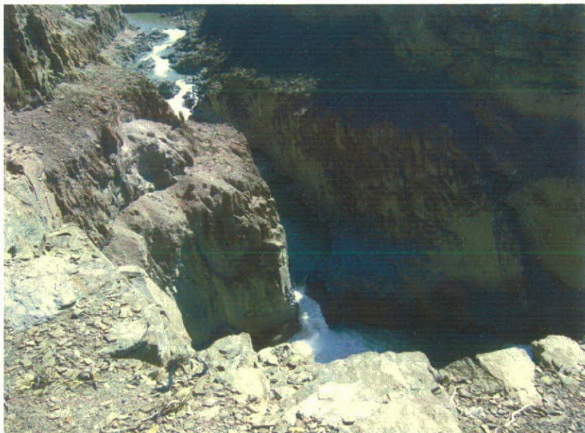
Foto: Vista de El Saltillo desde el primer balcón.

En el transcurso de esta segunda etapa del plan de trabajo previsto se debió desviar la atención de las obras a realizar en la zona de El Saltillo en sí misma y establecer contacto con la Interventora de la Comuna rural para que se efectuaran acuerdos con los pobladores de la zona, dado que al momento de comenzar las obras existieron resistencias para ejecutarlas.