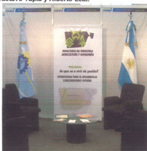
Vista de un sector del Stand.