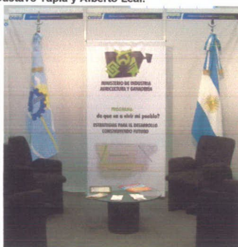
Vista de un sector del Stand.