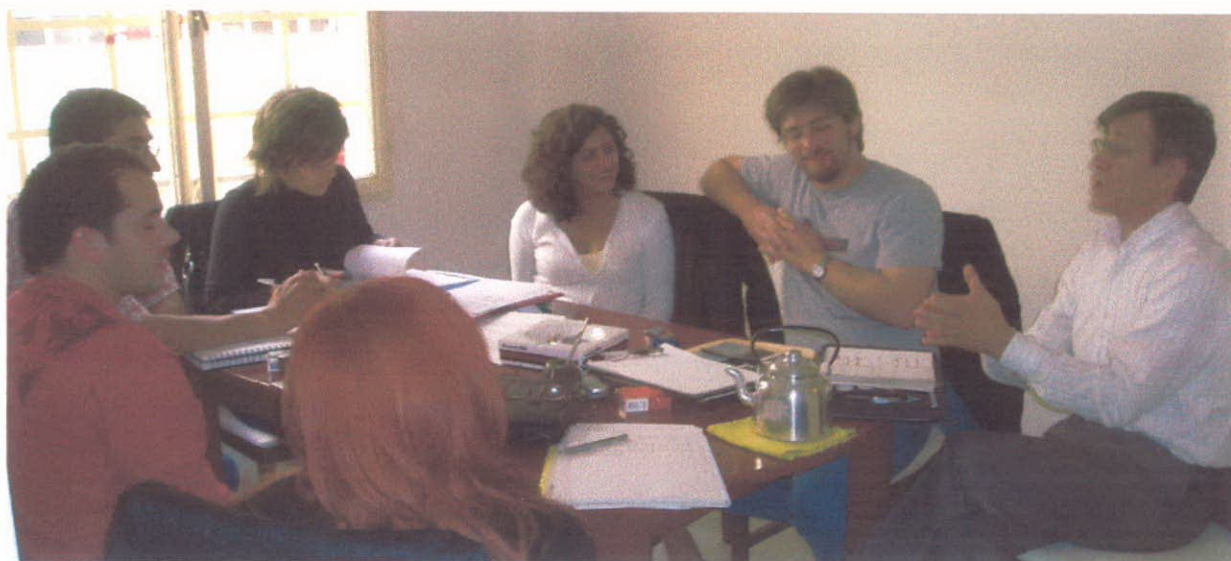
Reunión de las cuatro comarcas con la coordinación general en Comodoro Rivadavia

También se realizaron en la sede del gobierno provincial diversas reuniones por sector, eje y proyecto, de la Comarca de los Andes, para realizar los seguimientos, fortalecer los marcos de los acuerdos y los aspectos específicos de la ejecución de los proyectos.