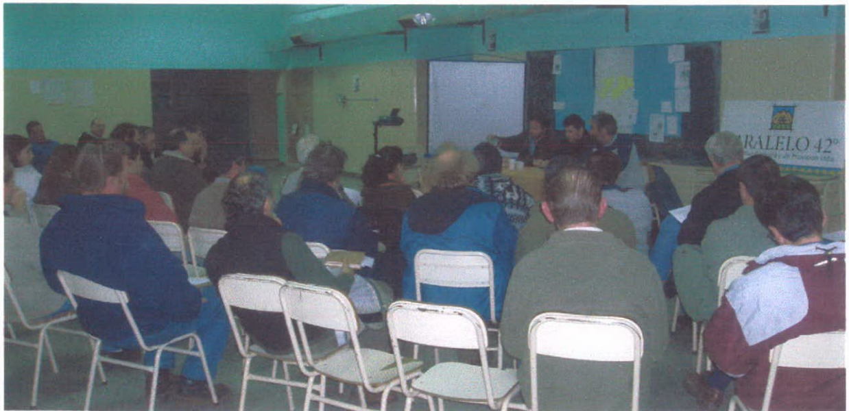
Convocatoria a productores de la Coop paralelo 42° para trabajar en BPA y BPM

En este proyecto la coordinación trabajo con el formulador, las autoridades locales y organizaciones intermedias llegando a los productores interesados en el proyecto.