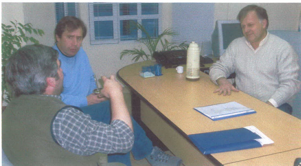
En la foto se ve la reunión con el Intendente de la ciudad de Tecka por la localización de una planta de impregnación de madera

En este proyecto la coordinación trabaja en la articulación con los distintos organismos oficiales para la ejecución de las líneas de proyectos, los cuales están próximos a comenzar su ejecución definiendo localizaciones y coordinando con las instituciones.