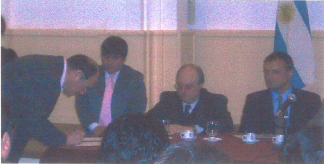
En la foto se ve el momento de la firma del acuerdo con PETROMINERA S.E.

Se firmo el acta de intención con una empresa del estado provincial PETROMINERA plasmando la asociación entre empresas para la ejecución, puesta en marcha y manejo de la planta industrial pilar del polo minero.