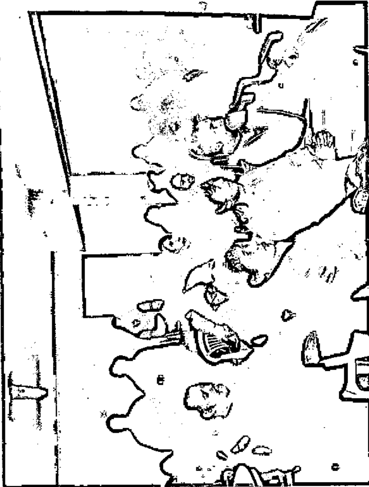
Participó un número importante de productores y funcionarios de áreas de turismo municipal de la región

Wyes por su parte fue quien se encargó de abordar conceptos generales y otros específicos vinculados con la modalidad del turismo rural, las cuales si bien son muchas cada una tiene su particularidad, atractivo y público, teniendo en cuenta que si bien todos los visitantes arriban en cantidad de turistas no todos buscan lo mismo ni eligieron el lugar con la misma intensidad. Esta situación obliga al destino a