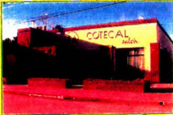
Salón de uso Social para asociados a Cotelal

PROVINCIA DE RIO NEGRO PATAGONIA ARGENTINA