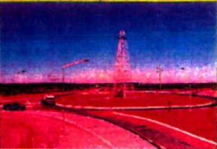
Rotonda de Acceso Sur y Ruta 151, Obra donada a la comunidad por Cotelal