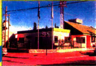
Administración y Central Telefónica de Cotelal