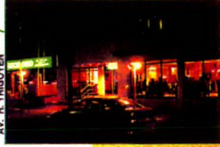
Locutorios Cyber Café y Cine