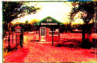
Portal del Complejo Recreativo de Cotelal

Servicio y Presencia Junto a Su Comunidad