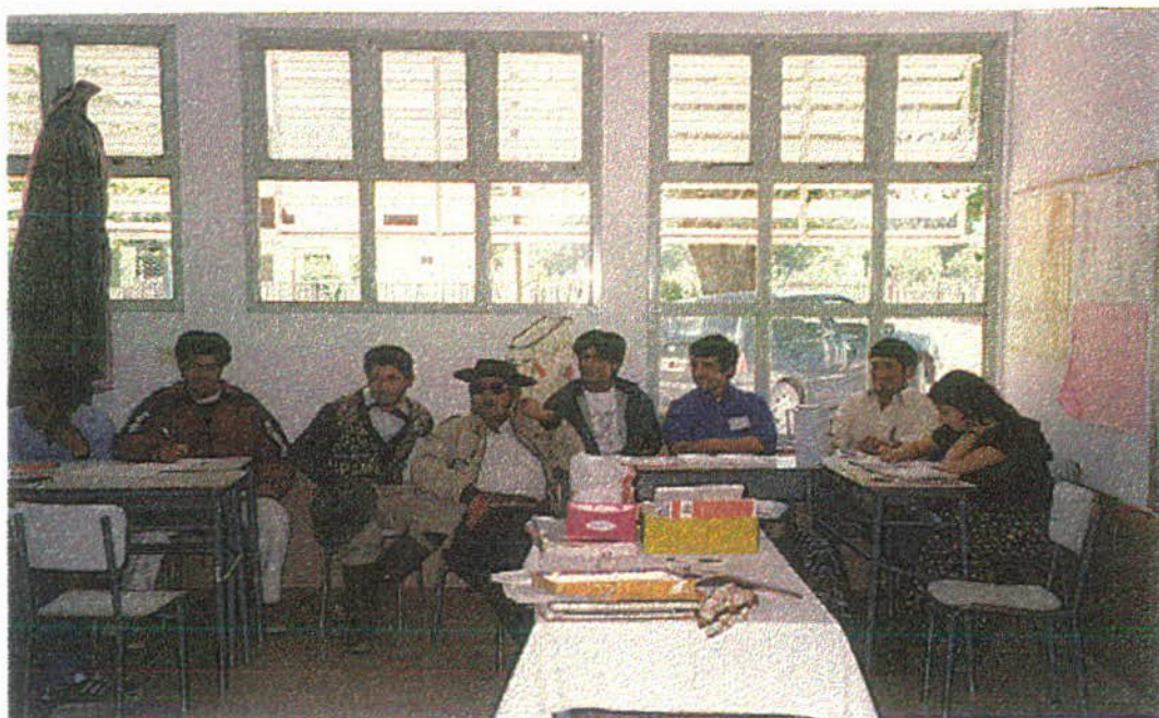
Un momento del Taller de Agentes Rurales

La comunidad se halla dividida en medio por dos personas ocupantes de tierras fiscales, no integrantes de la comunidad.