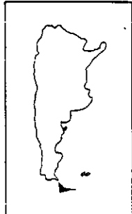
PLANO DE UBICACION

MATERIAL EMPLEADO Estrecho de Magallanes I.G.M. USHUAIA I.G.M. esc. 1:500 000 Mapa Tierra del Fuego esc. 1:500 000 de la D.N. de 6 y M.