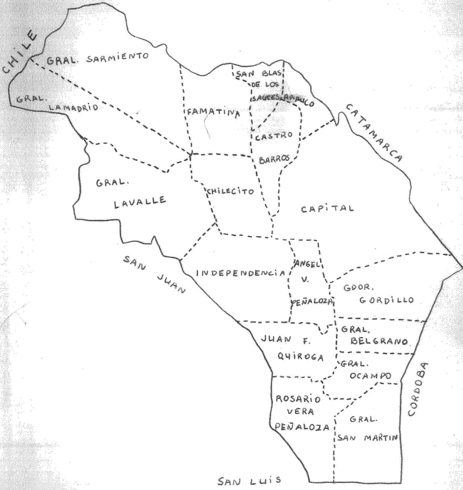
Grafico Nº 2